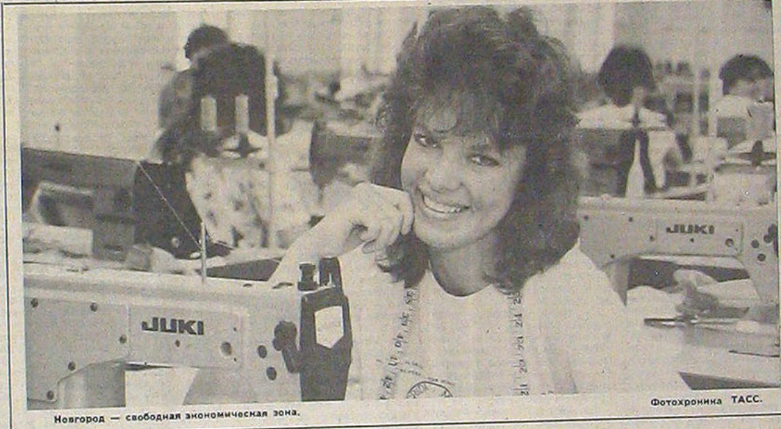
Новгород — свободная экономическая зона.

Буш заявил, что Литва — это не только страна, но и народ, который заслуживает уважения.