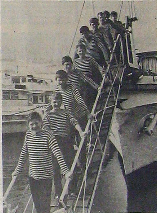
Ярославль. О том, что наннули — отмахиваются, знают даже первоклассники...