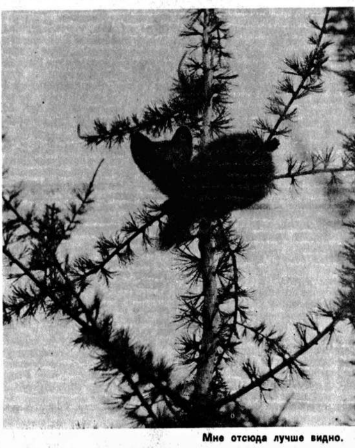
Мне отсюда лучше видно.

До сей поры старшей именовалась одна газета в Ярославле — орган областной организации коммунистов «Северный рабочий», первый номер которой вышел в 1908 году... Великом Устюге. Однако с возобновлением выхода «Ярославских Епархиальных ведомостей», которые ведут свою историю еще с 1860 года, было превосходство нарушено. После 75-летнего молчания газета вернулась к своим читателям-верующим.