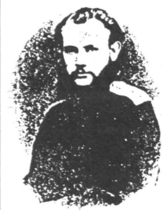
Петр Алексеевич Кропоткин (1864 г.)