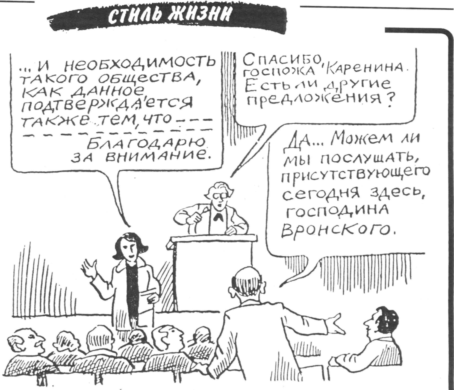
Рисунок Михаила Беломлинского из книги Г.М. Роберта