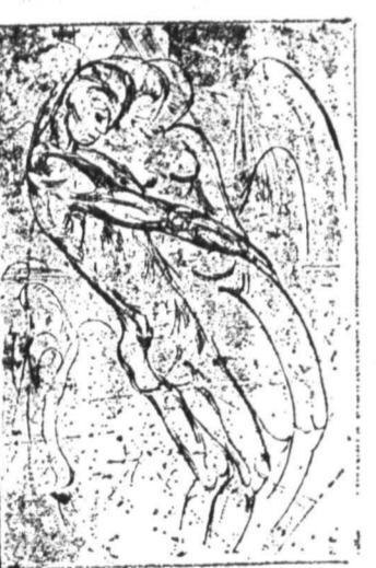
Вильгельм Лембрук, «Паоло и Франческа», 1913 г.

тяжелые массы Генри Мура. Было представлено пришедшее из Соединенных Штатов так называемое «минималистское искусство», достаточно холодное, чуждое какой-либо экспрессивности, использующее к тому же такие материалы, как кожа, кирпич, сталь и прочую промышленную продукцию (Андре Флейбин, Ричард Серра и др.).