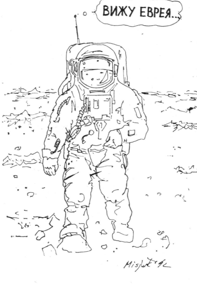
Рисунок Вадима Мисюка.

А после — внуки и внучки, сестры мои и братья, двоюродные и родные: Яша, Саша, Илоша, Гриша, Аркаша, Андруша, Ольга, Олег, Владимир... И среди них — я.