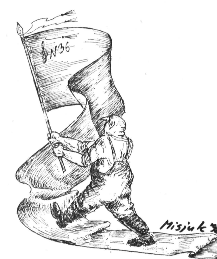
Рисунок Вадима Мисюка.

Другая, не менее злободневная претензия к власти — это усиление авторитарных тенденций. Формальное согласие с необходимостью разделения в демократическом обществе власти так и не стало фактом нашей жизни. И это объяснимо: мы столько лет жили в условиях, когда такого разделения практически не было, а происходящее их формирование идет слишком медленно.