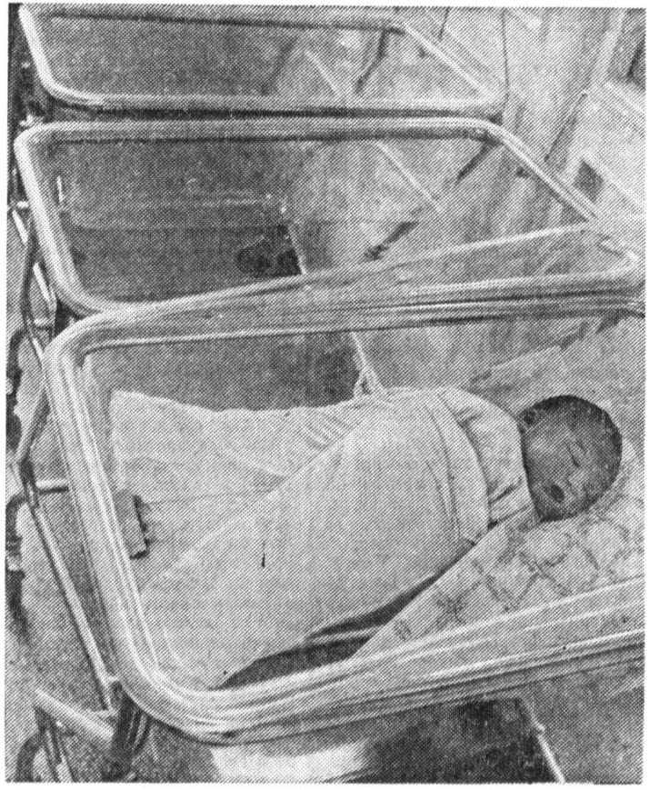
Число абортов в России в два раза превышает число рождений.

ларов. Помимо этого, госпожа Хофман провела встречу с врачами... Представителем женских организаций... (News article text about abortion alternatives in Russia)