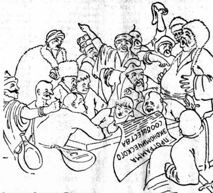
Рисунок Виталия Плотникова.

— В политическом смысле мы ждем полной независимости, а в экономическом — содружестве