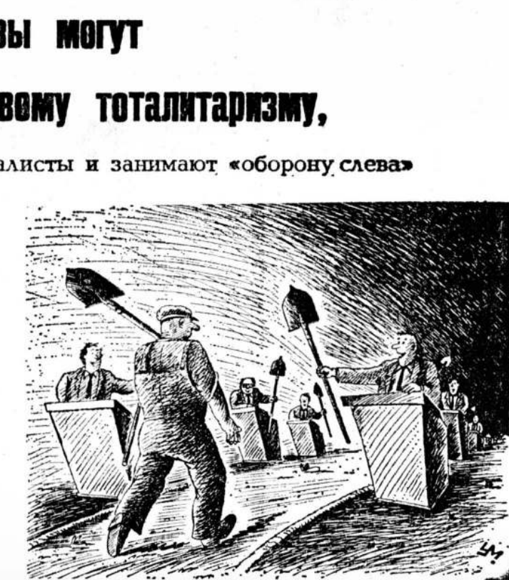
Рисунок Александра Ульяева.

Во-вторых, какими чрезвычайными обстоятельствами объясняется упорное желание различных российских инстанций делать далеко идущие заявления, идущие в том числе и за пределы собственной компетенции? В этом плане документ, изготвленный Госсоветом, весьма незначительно отличается от памятного «пограничного недоразумения» Воинова. В-третьих, в какой степени допустима двусмысленность толкования «позиции» Госсовета? Может способствовать обеспечению прав граждан, этнически связанных с ними? Может, не уже надлежит роль ставки в чужих политических играх? В сущности, прикладной смысл опубликованного документа представляется крайне сомнительным. Очевидно, что это — очередная политическая акция, предпринятая даже, может быть, на самых благих побуждениях, но, увы, безрезультатно.