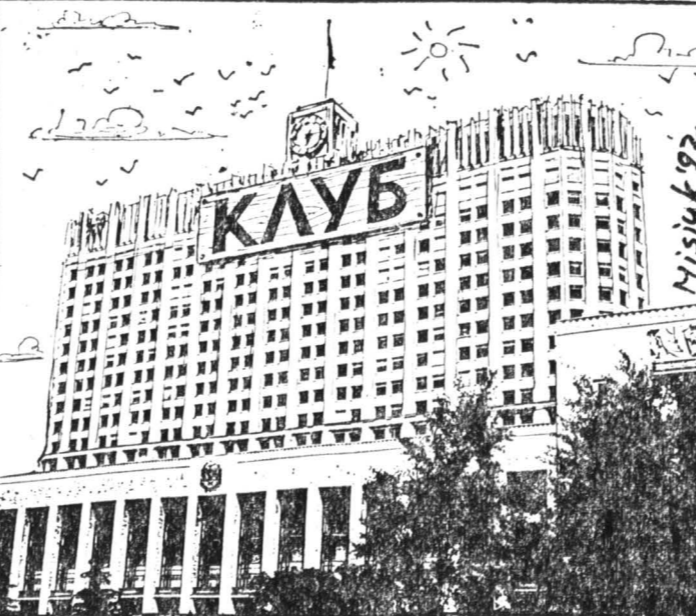
Коллаж Вагима Мисюка.