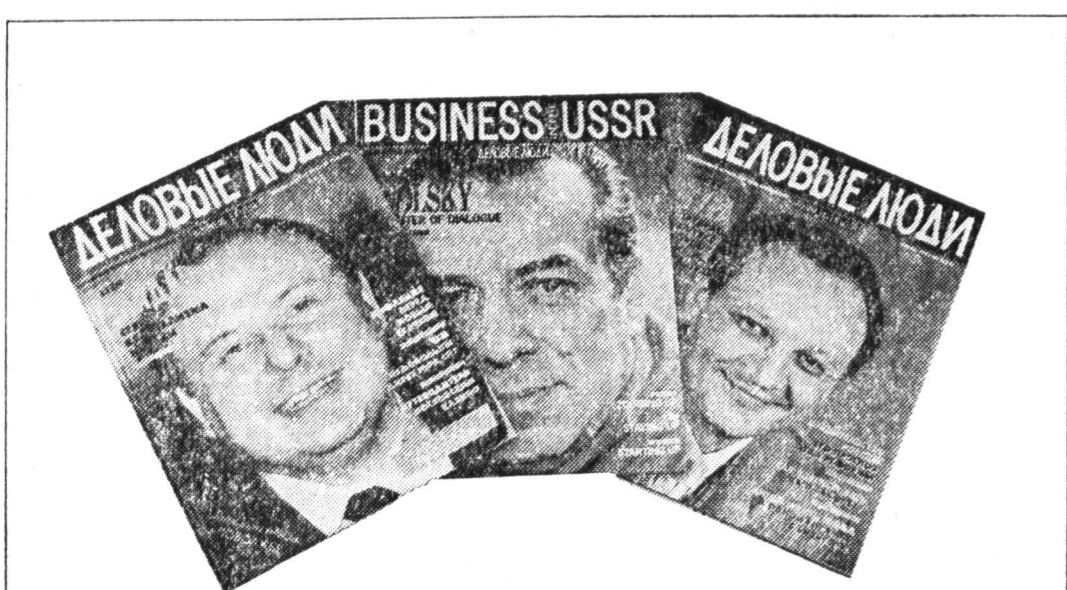
ЕСЛИ ВЫ ДЕЛОВОЙ ЧЕЛОВЕК, ВАШ ЖУРНАЛ — «ДЕЛОВЫЕ ЛЮДИ»!

Касаясь экономических проблем, глава парламента заявил, что либерализация цен была ошибкой и привела к ухудшению экономического положения. Станислав Шушкевич объяснил это некорректностью мер. Он также отметил, что Запад и общественное мнение внутри республики подталкивают руководство республики к решительным реформам.