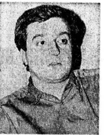
Г. Чантурия.

Как уже сообщала «НГ» (№ 111), 16 сентября при попытке вылететь в Москву был арестован один из лидеров оппозиции — председатель Национально-демократической партии Грузии Георгий Чантурия. Наш корреспондент «успел» встретиться с ним за три часа до ареста.