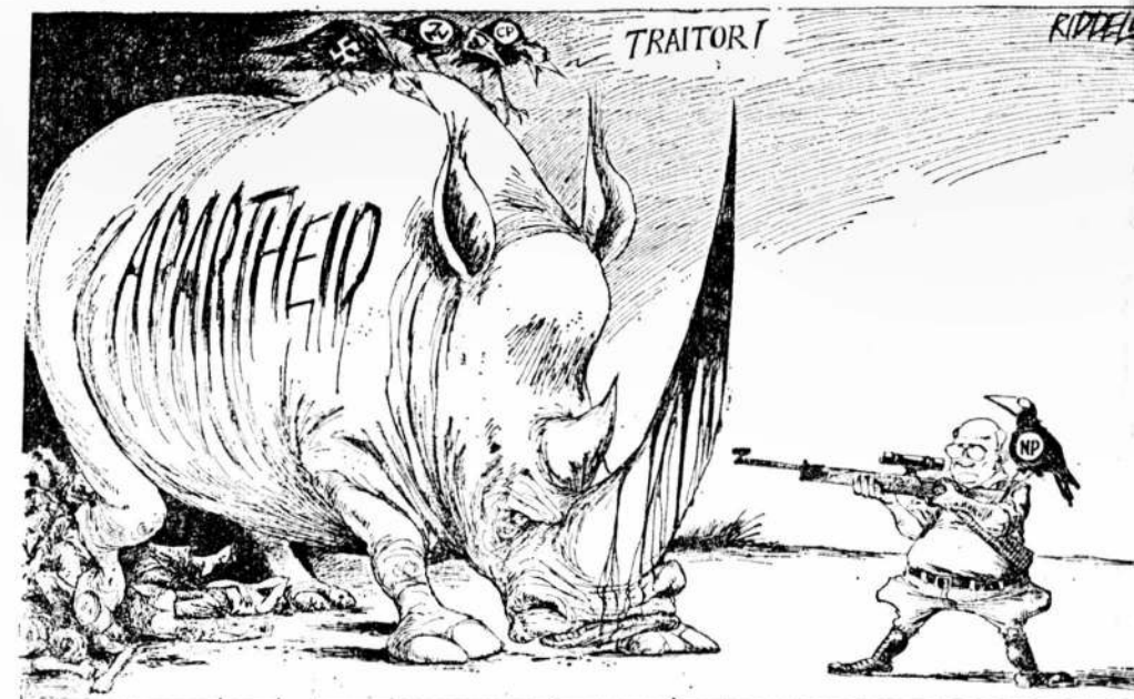
Консерваторы и бросербондовцы называют де Клерка предателем, а тем временем потопленные носорогом апартеида уже борются между собой.

Утверждают, что «Инката» действует по тайной поддержке полиции. Нельсон Мандела назвал это «третьей силой», на практике же существует несколько