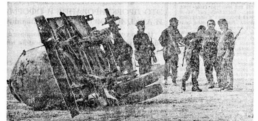
Армянское село Эрчек, жители которого были депортированы месяц назад, контролируется гинджанским ОМОНОм. Азербайджанские семьи (в основном беженцы из Армении), госпитализированные в оставленных домах, вскоре ушли, так как Эрчек по несколько раз в сутки подвергается интенсивному обстрелу из автоматического и ракетного оружия со стороны местных партизан и приезжих добровольцев, хоронящихся в окрестных лесах. Эта фотография сделана спустя полчаса после боя. В 500 метрах от границы села на высоте, откуда велся огонь, были найдены автоматные гильзы и укупорка от ПТУРС «Фагот».