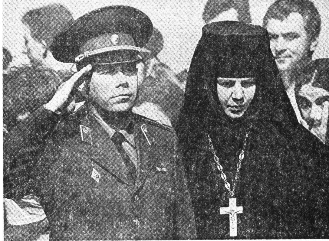
Памяти всех павших на Бородинском поле 180 лет назад.

По улицам Москвы бегали официанты, а в небе над Тушино тарахтели «Голубые ангелы»