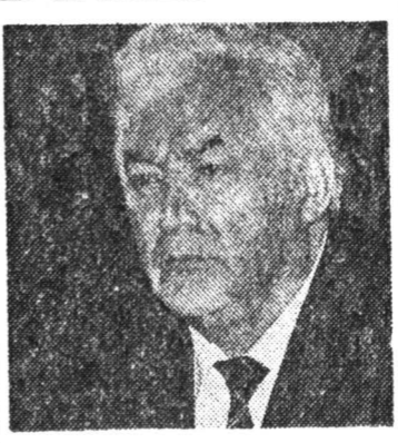
Рахмон Набиев.

Отставка Набиева — это важный шаг, который поможет стабилизировать обстановку в республике, по крайней мере ускорит переговоры между правительством и пронабиевскими формированиями в Кулябской области. Президентских выборов в Таджикистане, по всей вероятности, не будет, и власть в республике перейдет к парламенту, так как сложные межклановые и межродовые отношения не позволят избрать такого президента, который бы отвечал интересам жителей всех областей и районов Таджикистана.