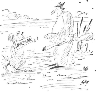
Рисунок Александра Умярова

НА ПОСЛЕДНЕМ заседании Малого Совета Мособлсовета было принято решение временно ввести на территории области плату за выдачу лицензий на добычу диких копытных животных. Лось, европейский олень (марал) и пятнистый олень в возрасте «на реву» требуют лицензий в 2500, 1500, 1000 рублей соответственно; охотное разрешение на кабана — 765 рублей, на косулю — 450.