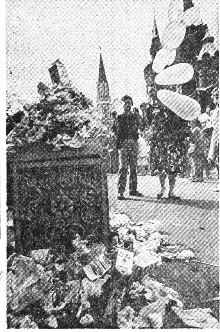
Баши мусора на Красной площади. Фото Андрея Абриштова и Дмитрия Борко (ИГ-фото)

баталиях, участвовавших в сражении. Фото Андрея Абриштова и Дмитрия Борко (ИГ-фото)