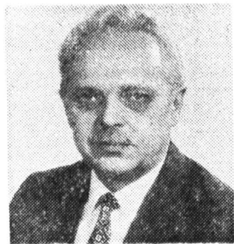
Министр Э. Днепров.