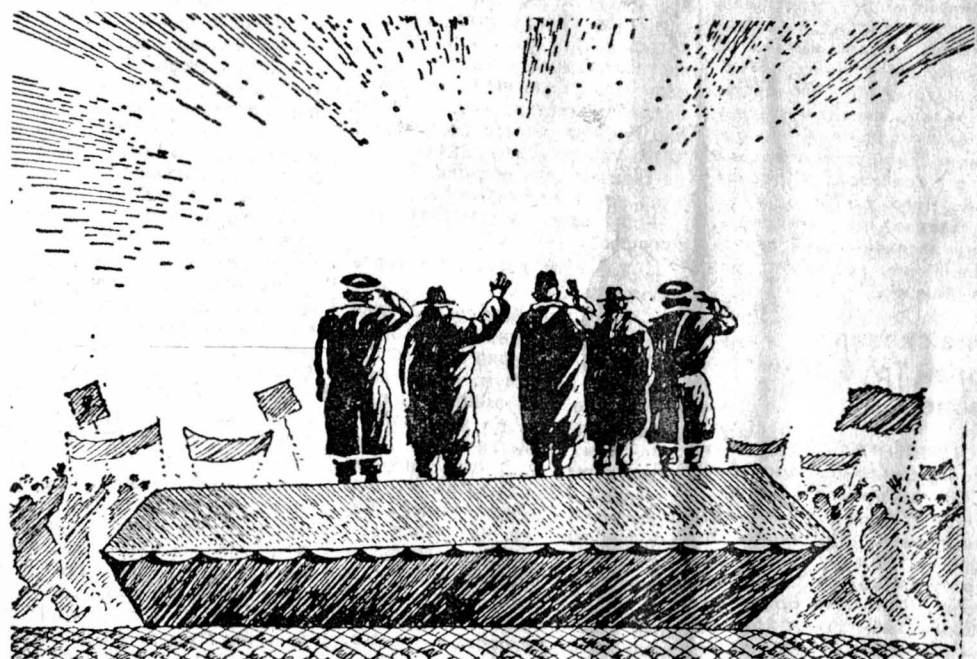
Рисунок Алексея Меркулова.

А когда чуть позже, весной, Верховный Совет СССР открыто противопоставил себя новоогаревскому процессу, опираясь именно на эти решения съезда, мы впервые заговорили о проблеме ликвидации консервативных законодательных органов Центра как о проблеме насущной. И сразу заметили: действующая Конституция не содержит законного механизма роспуска съезда по инициативе и вне закона о референдуме запреща-