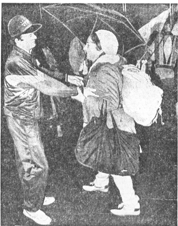
Через год они вновь встретились у Белого дома