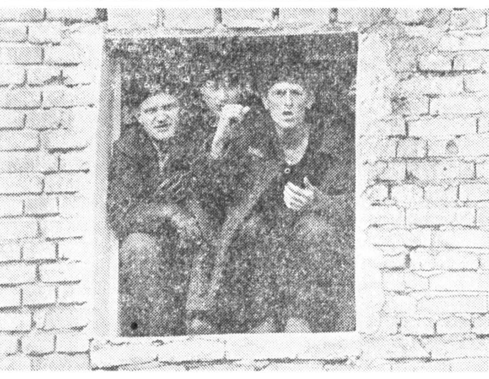
Забастовки, голодовки и другие акции неповиновения стали привычным явлением в российских колониях. На этом снимке — эпизод забастовки заключенных Читинской колонии ЯТ-14/4, требовавших улучшения медицинского обслуживания, повышения заработной платы, гуманного отношения администрации зоны к заключенным.