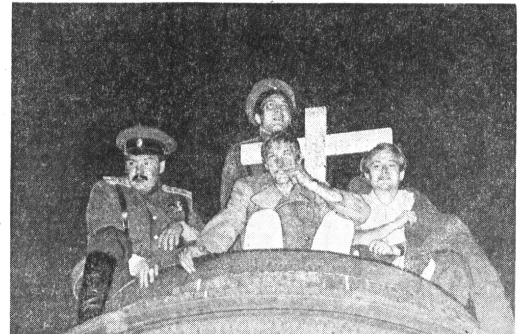
Вместо Железного Феликса — вновь лихие казаки