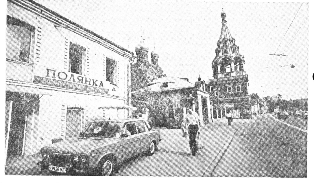
Замоскворечье, ул. Полянка.

Москворецкий мосты торговое население Замоскворечья. Таким образом, ссылка на историю фальшива. Да к тому же архитектурной мастерской, возглавляемой человеком со слишком знакомой москвичам фамилией М. Посохин (тот самый? или другой? представить династия «реставрации» и задача «проектирования, строительства и реконструкции» зданий заповедного района, разумеется, согласно интересам «товариществу». Как поступают в таких случаях в Москве со многими старыми объектами, уже известно: выселяют жильцов, ломают крышу, помогают зданию окончательно ступить, а потом снимают с охраны и сносят как безнадежное — тут уже можно строить заново что душе угодно. Но дело не только в угрозе