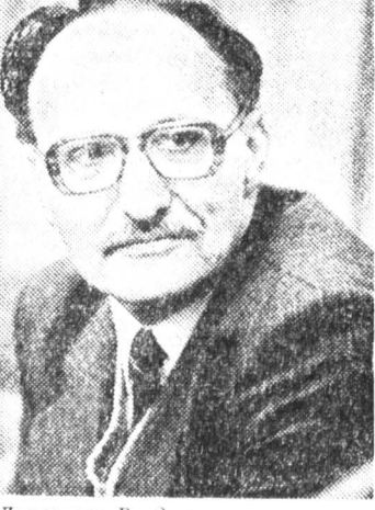
Литератор Владимир Яковлевич Лакшин.

Д ЕШЕВАЯ распродажа и разграбление остатков старой Москвы продолжается. Метод, опробованный — без сопротивления населения — в разных районах города, получил более широкий размах в связи с планируемым захватом территории Замоскворечья, Якиманки и Патричной улицы — чудом уцелевших остатков исторической Москвы. В глубокой канцелярской тайне от общественности и населения района, которым надлежит внезапно оказаться перед свершившимся фактом (а мы все еще кричим об эпохе гласности!), подготовлен и уже согласован в одиннадцати инстанциях проект, который остался подписать Ю. М. Лужкову. Нужна лишь его подпись — и можно вызывать ОМОН для принудительного отселения лиц, учреждений (будьте уверены, добровольно мало кто поедет) с целью захвата новыми конкистадорами под предлогом реставрации и реконструкции домов и старых объектов на Якиманке, Патричной, Орднике Большой и Ордынке Малой прилегающих переулков. Метод передачи зданий новым владельцам прост и крут, как лайон. Создается товарищество с ограниченной ответственностью. Муниципальная собственность передается «товариществу» в полное хозяйственное ведение, прежние договоры на аренду ликвидируются. Располагающие средствами «коммерческие структуры» вносят деньги на реконструкцию освобожденных зданий под свои нужды, а затем на 49 лет получают их фактически в