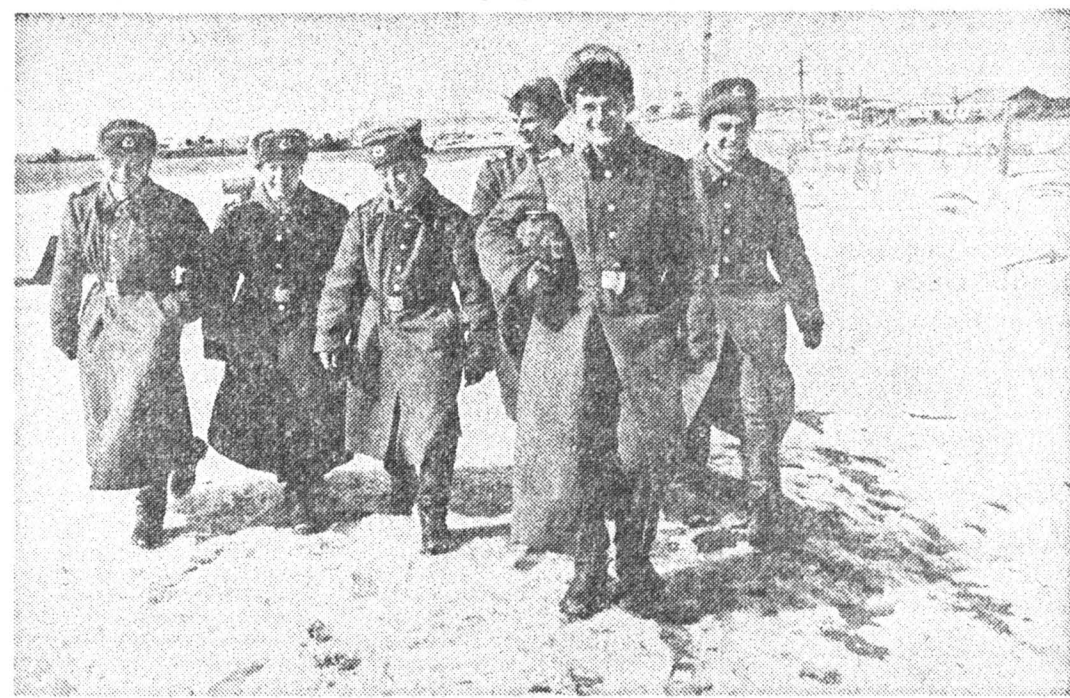
Поселок Головинно (Южные Курилы). Эти солдаты несут службу по охране береговой линии острова.