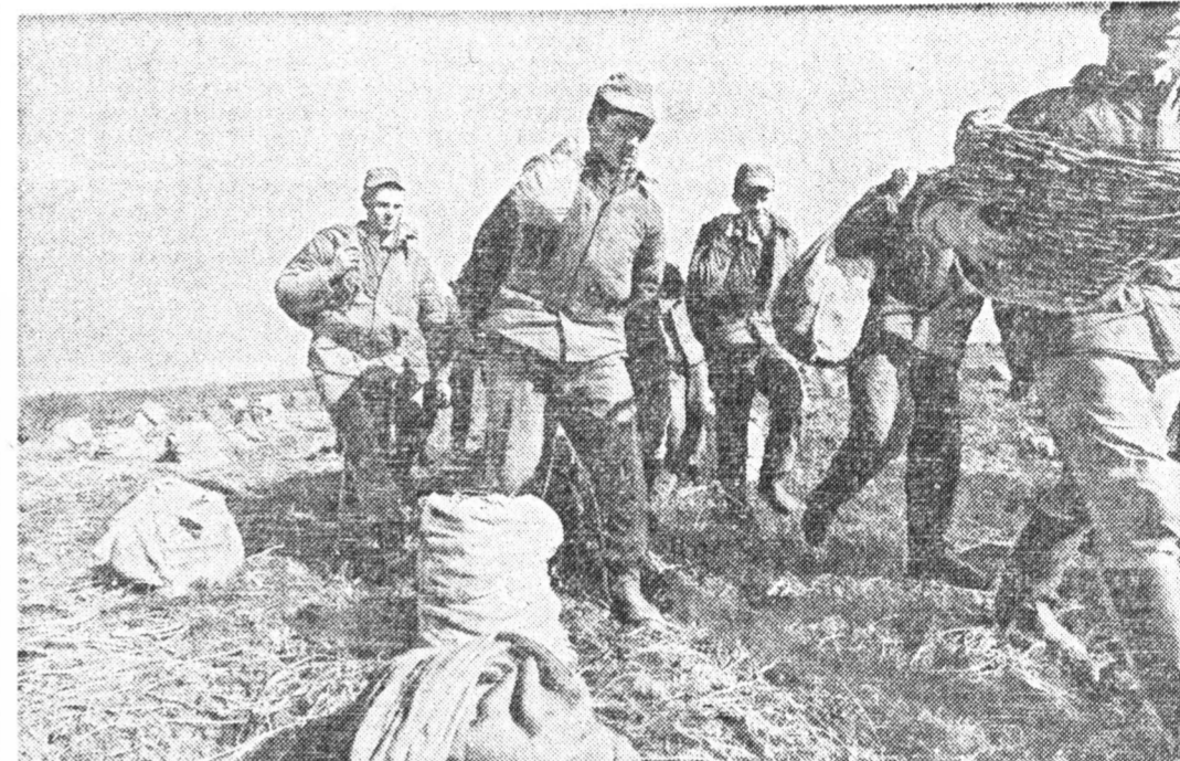
Бородинское поле: сажать картофель или консервировать историю?

НАСЕЛЕНИЕ, живущее в окрестностях знаменитого Бородинского поля (8,5 тыс. человек), до сих пор переживает последствия Отечественной войны 1812 года. Людям не разрешают строить дома выше тех, которые были во времена нашествия Наполеона, запрещено возводить кирпичные и прочие постройки — только деревянные. Населенным пунктам, находящимся на территории музея-заповедника, нельзя разрабатывать за существующую границу. На окрестных полях нельзя селить кукурузу. Основание — во времена Кутузова и Наполеона она здесь не росла. Местным крестьянам, живущим в пределах охранной зоны, в нарушение российских законов, не выдают землю. Более того, работникам Бородинского музея-заповедника хотят провести в Верховном Совете России постановление, запрещающее на территории музея и его охранной зоны действие новых законов, регламентирующих земельные отношения. А ведь это огромная площадь — 645 кв. км! Сама заповедная зона составляет примерно шестую часть — 109 кв. км.