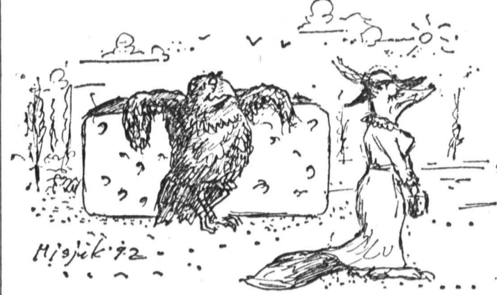
Рисунок Вагима Мисюка.

Действительно, последователь и всеохватывающее осуществление принципа удовлетворения как раз объединяет социальность и соответственно ин-