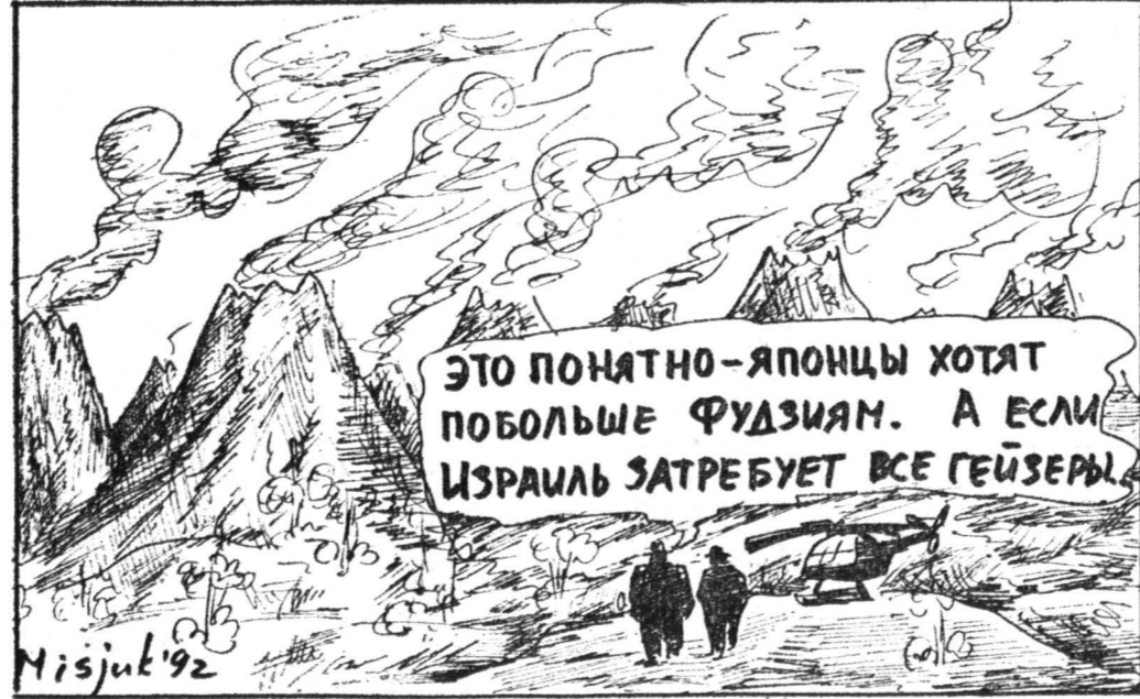
Рисунок Вадима Мискова.

Новая Россия заявляет о себе как о правовой государстве, в котором не партийный аппарат и не группа ему приданных министров призваны решать важнейшие проблемы страны. Решения правительства во внешнеполитической сфере должны го-