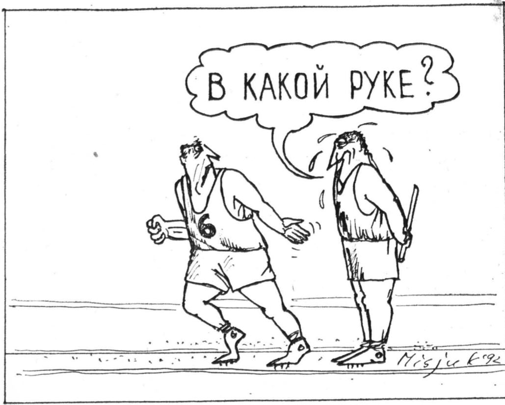
Рисунок Вагима Мусюка.

Добившись независимости политической, Украина и Грузия стали стремиться к независимости спортивной, предлагая поехать в Барселону самостоятельными командами. Но Международному олимпийскому комитету предложение не понравилось: если разрешить двум, то разрешать всем, а это порождает такое количество проблем, что с ними практически невозможно было бы справиться до начала Игр. Зависа от необходимости защитить спортсменов, МОК поставил «железную самостоятельность» ультиматум: выступление под одним флагом, либо вопрос о принятии в члены МОК будет отложен на неопределенный срок. Так родилась объединенная команда (ОК), которая, как и в феврале этого года на зимней Олимпиаде в