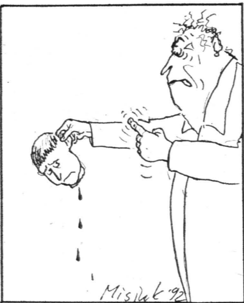
Рисунок Вадима Мисюка.

Иной читатель, как оказалось, не обладает воображением. Прочитав мои заметки «Я-некрофил» («НГ» 25.06.92), ко мне впадал в бесчувствие. Когда чувствую в себе синдром мертвотолпы, то помалкиваю. А это публичное признание... Соседи бросились признавать от меня малолеток. Коллеги стали журить: «Павел! Сеченович, что мешало вам написать теоретическое эссе о некрофилии? Зачем вы опрокинули все это на себя?»