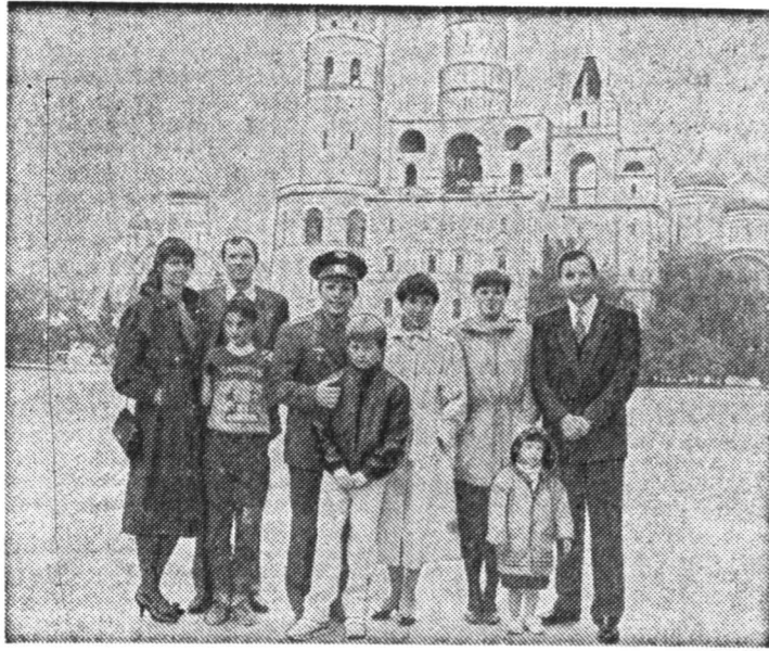
Участники российско-французской космической экспедиции с семьями на Красной площади.