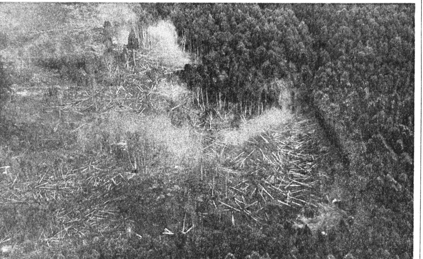
Лесные пожары в Подмосковье.

Комитет по лесу, имея перед глазами метеорологические карты прогнозов на лето и просчитав возможные масштабы бедствия, еще в апреле обратился в правительство с просьбой выделить им дополнительно 1,4 млрд. рублей. Деньги выделили, но 558 млн., большая часть которых тут же ушла на покрытие долгов. Прогноз погоды подтвердился.