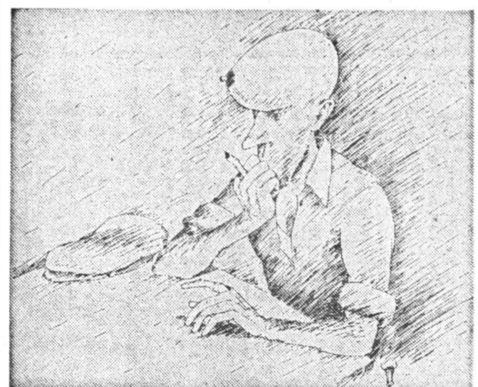
Рисунок Тимура Козаева.