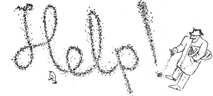
Рисунок Вадима Мисьяка.

но теряет свои товарные качества. Лишь немногие хозяйства могут похвастаться собственной инфраструктурой хранения урожая. Ситуация усугубляется начавшимися в южных областях дождями. Следует напомнить, что в этом году правительство первый раз отказалось от регламентированной закупочной цены на зерно. 4 января Борис Ельцин издал указ о формировании государственного продовольственного фонда по свободным рыночным ценам. Тем не менее правительство сохранило госзакупки в размере 29 млн. тонн, или примерно 30% от валового сбора зерна. Именно за эти 29 млн. тонн и идет война между госпроизводителями и госпокупателями. Фактически колхозы-совхозы все еще прочно удерживают монополию на сельхозпродукцию. Доля фермерских хозяйств не превышает 3—4%. Поэтому, несмотря на указ Ельцина от 4 ян-