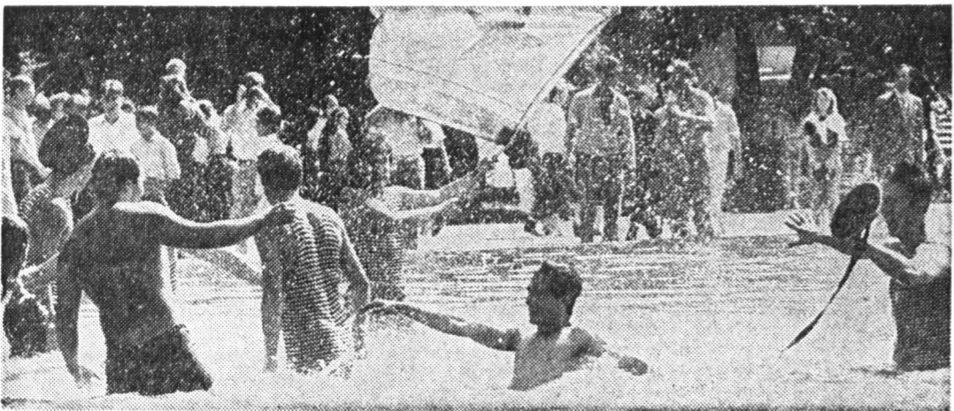
Освежающая процедура в пруду парка культуры им. Горького.

Если, конечно, его у вас после этого прибавится