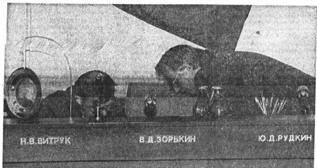
Истцы и ответчики (вверху). Объявлен перерыв в заседании Конституционного суда (внизу).