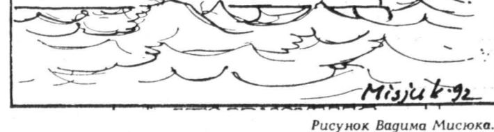
Рисунок Ваима Мусюка.

1. «У Терписторы» («Россия»). 2. «Отдашки» (Вид, «Останкино»). 3. Грета Гарбо в фильме «Анна Каренина» («Останкино»).