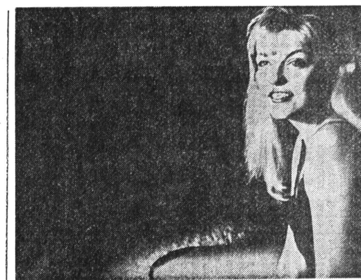
«Твин Пикс» Дэвида Линча: кошмарная предстория событий, рассказанных в одноименном телесериале, популярном у наших видеоманов. Наконец-то раскрыты все тайны.