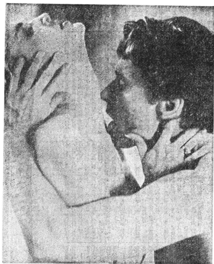
Майка Дуглас и Шарон Стоун в триллере «Необоримый инстинкт». Эротические сцены сняты с редкостью для Голливуда откровенностью.