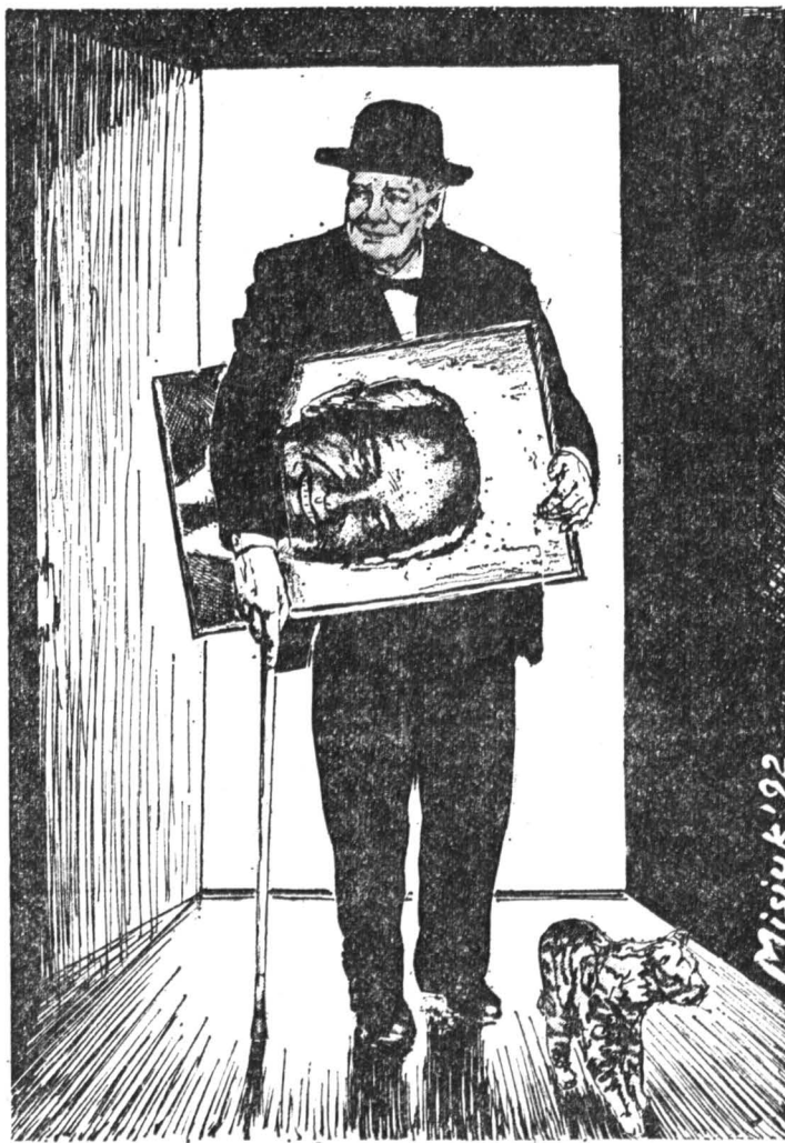
Коллаж Вагима Мисюка.

Речь Уинстона Черчилля в Вестминстерском колледже, Фултон (США), 5 марта 1946 г.