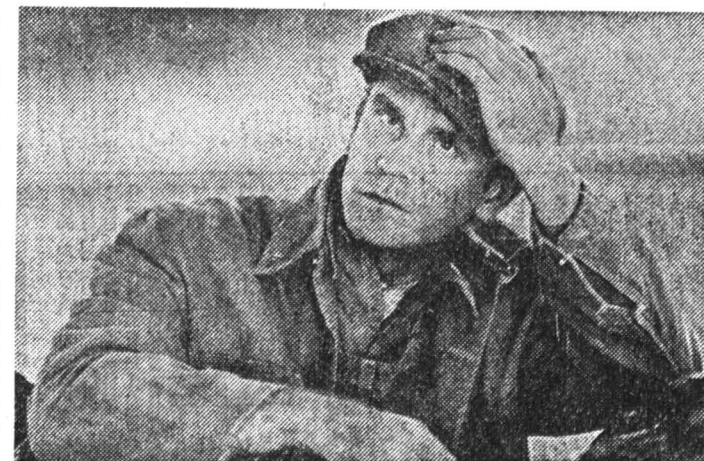
Джим Малкович в фильме «О мышцах и людях». В «рабочее-крестьянское» парне, к тому же гурчке, не узнать артиста из фильмов «Опасные связи» и «Раскаленное небо».

Каннского фестиваля слишком много. Я это понял в один момент, в мае, около полуночи второго дня фестиваля, когда только что приехал на поезд из Марселя и, весь... на приблизительно знал, где мой отель, очутился на сверкающей огнями (пошло, но правда) знаменитой набережной Круазетт, переполненной людьми настолько, что анаксу негде упасть. Ката за собой чемодан на колесиках и постоянно оборачиваясь, ибо на чемодане покусались сесть верхом, я краем глаза успевал коситься на гигантские рекламные щиты, где привлекали внимание то Мишель Фрайфер в маскарадной маске, возмущающая, что «Бэтмен возвращается», то Мел Гибсон с Денни Гловером и пистолетом в руке, решившиеся на «Смертельное оружие-3», то Джон Войт в форме офицера советской милиции, оповещающий о новой современной версии «Преступления и наказания», а то и вовсе даже статуя Свободы, проваливающаяся в тартарары на афише всеми заочно хвалимого фильма Эмира Кустурицы «Американские мечтатели». Первые дни три — ощущение, что из этой толпы не вырваться никогда. Хотя чемодан уже в гостинице. Туло ходишь на официальные просмотры. С тупой тоской вынимаешь из своего пресс-бокса килограммов рекламных проспектов. Говорят даже, что в Канне начинаешь хотеть, чтобы ты понимал только в третий или четвертый приезд.