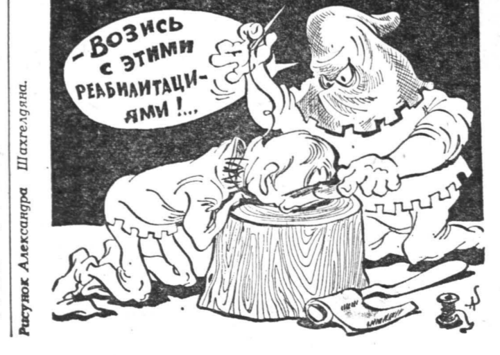
Рисунок Александра Шаталова.

20 МАЯ 1862 — США: Закон о гомстедах, по которому каждому гражданину предоставлялось право на получение, практически бесплатно, надела (гомстеда) площадью до 160 акров (65 га), который со временем переходил в его собственности. Победа фермерского пути развития американского сельского хозяйства. 1882 — Секретный союзный договор между Германией, Австрией и Италией (Тройственный союз). 1887 — В Шлиссельбургской крепости казнены участники «второго 1 марта» (попытка покушения на Александра III) — А. И. Ульянов и другие.