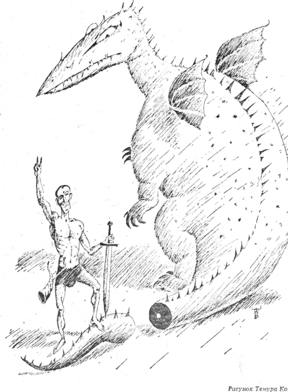
Рисунок Темура Козаева.

А что касается приоритетов, табели о рангах в истории, то при любой раскладке, на том все сойдется, мир живет в эпоху Горбачева. Нужно различать оловые и частные временные понятия. Процесс действительного пошел, и бурбулизация есть всего лишь этап в развитии горбачевизации. На сегодня — высший этап, обусловленный исчерпанностью, недееспособностью предыдущих. Как он называется и насколько нам нравится, не самое главное.