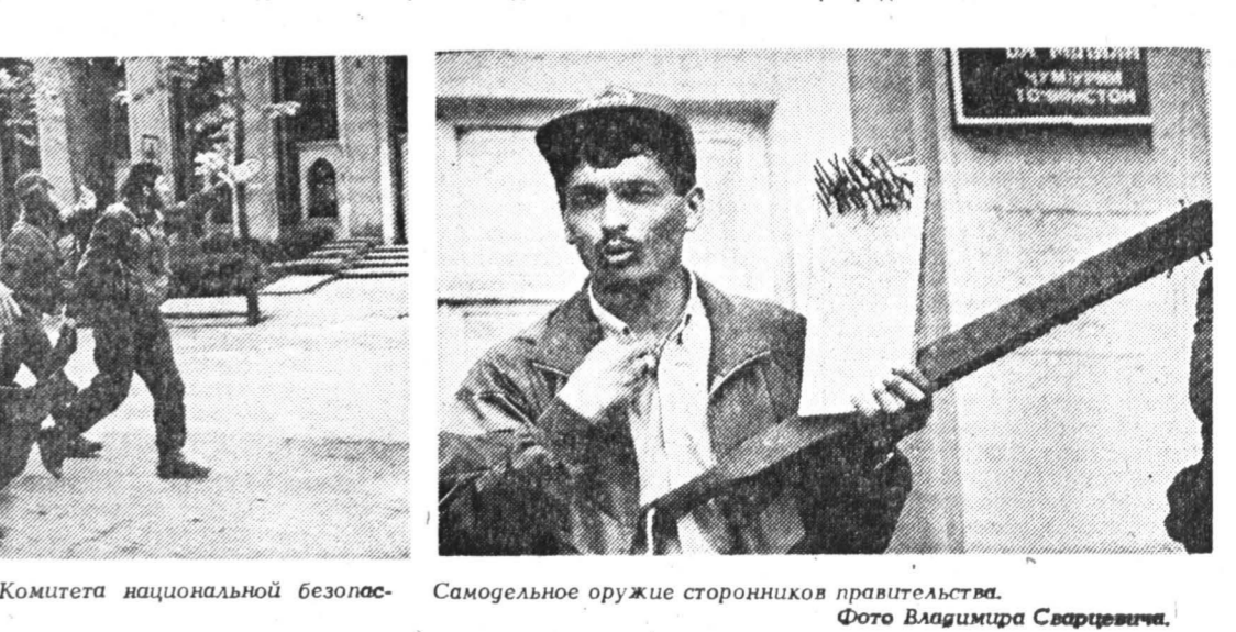
Самостоятельное оружие сторонников правительства.

пресс-конференции и сказал, что его партия и люди, находящиеся на площади Шохидон, не дадут в обиду национальные меньшинства в Таджикистане. Однако если в кассах Аэрофлота и на железнодорожном вокзале в предыдущие дни с билетами не было никаких проблем, то за день 11 мая все билеты на ближайшие 8-10 дней были проданы. Переговоры между правительством и оппозицией все еще продолжаются.