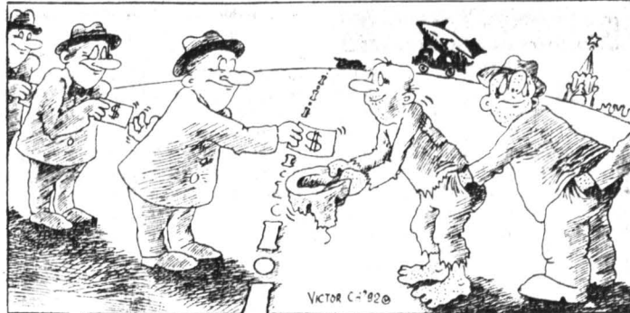
Рисунок Виктора Чумачева.

Заинтересован ли Запад в предотвращении дальнейшей дезинтеграции экономического и политического пространства бывшего СССР? Российские участники семинара исходили из предположения, что да. По моему мнению, Запад мог бы способствовать приостановке этого процесса,