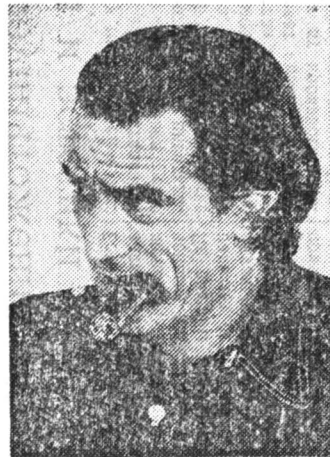
Роберт де Ниро в фильме «Мыс Страх».