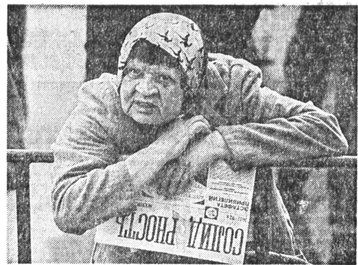
В Парке культуры им. Горького свою манифестацию проводила Московская федерация профсоюзов. За коммунистами профсоюзы на сей раз не пошли.