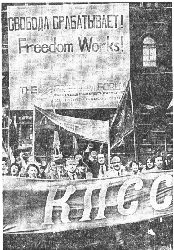
Москва, Красная площадь.

Х ОТЯ в нынешнем году российские власти не пожелали официально отметить 1 мая как праздник международной солидарности трудящихся, революционные традиции все же были сохранены. В этот день по инициативе движения «Трудовая Россия» Красная площадь была заполнена (пусть не так густо, как в прошлые годы) множеством людей с красными флагами, портретами Ленина и картами СССР, захваченными в качестве плакатов.