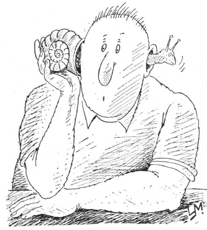
Рисунок Александра Умряева.

тут и процветают и никто никому не мешает. Наоборот, каждая помогает другой творить эту прекрасную картину мира. Здесь, глядишь, и обычный червяк тоже пригодится со своим нехитрым, но нужным обществу делом. Такие схемы эволюции в науке тоже есть... Х. ТИРАС, кандидат биологических наук г. Пущино, Московская обл.