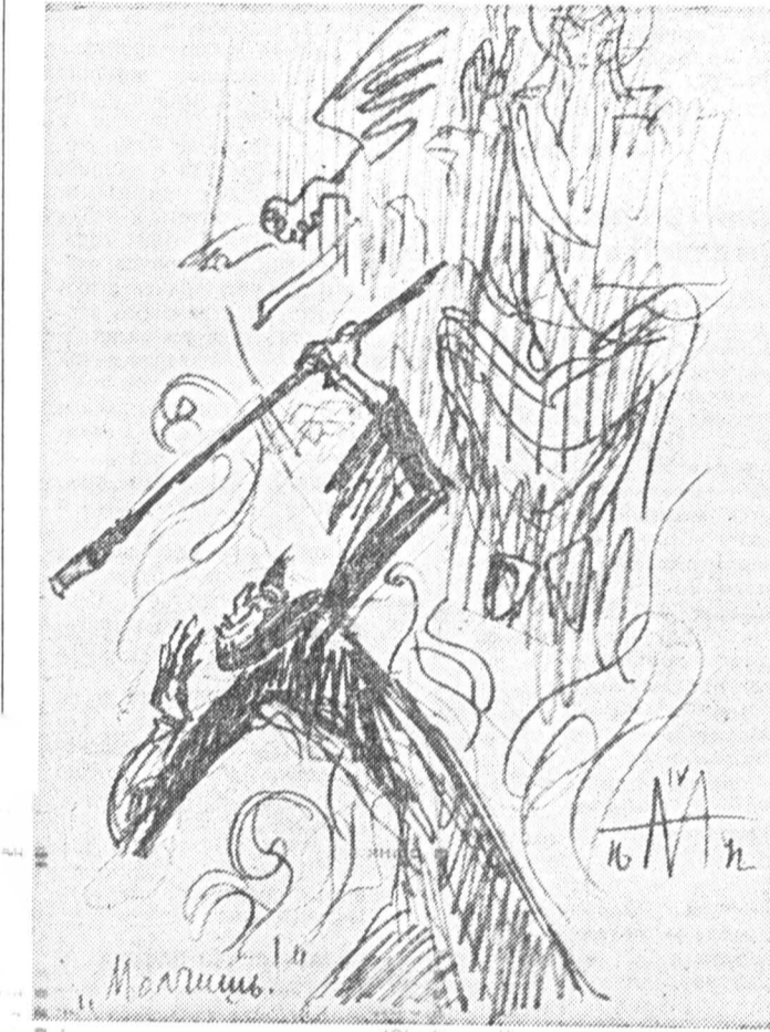
Сергей Эйзенштейн. набросок к третьей, неосуществленной, серии «Ивана Грозного».

«Спустя еще пять лет вторая серия Эйзенштейновского «Ивана Грозного» вышла на экраны мира».