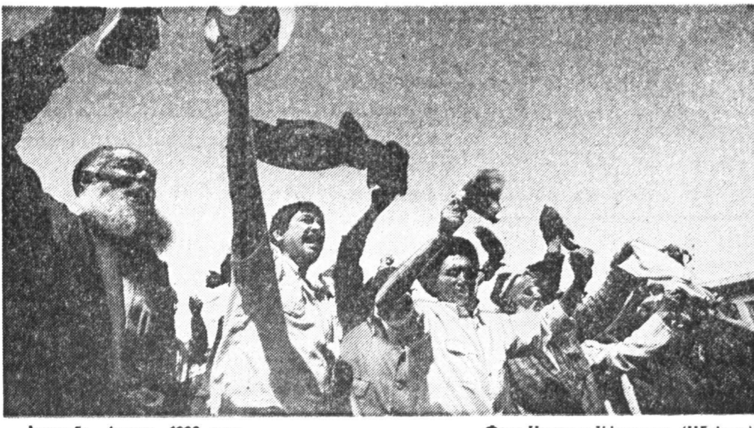
Душанбе, апрель 1992 года.

нов императорской Фамилии в этом месте. Г-н Чавчавадзе не уверен, что такой категорический приказ когда-либо был. Вместо Петропавловского собора были предложены Свято-Александр-Невская Лавра и временное захоронение в ее стенах. Но Великая Княгиня Мария Владимировна твердо настаивала все-таки на Петропавловском соборе. В случае окончательной невозможности этого представители Российской дворянской собрания предложили Новоспасский монастырь в Москве, где находится родовая усыпальница рода Романовых. В понедельник поздно вечером решение, кажется, было найдено. В Санкт-Петербург прибыл Патриарх Московский и Всея Руси Алексей II, который будет отвечать Великому Князю в Исаакиевском соборе. Тело Владимира Кирилловича до сорокового дня будет закрыто в специальном саркофаге, который поместят в Петропавловском соборе. За это время должны быть закончены реставрационные работы», после чего и состоится погребение.