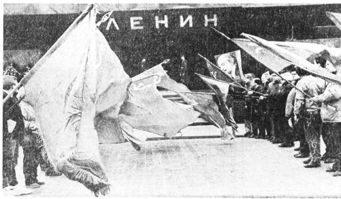
Москва, Красная площадь, 26 апреля 1992 г.

державшую хулу в адрес правительств России. Собравшиеся скорбно внимали ему. Некоторые поднимали руки, сжатые в кулак, и махали в сторону купола Кремлевского дворца, где на последнем этаже работал вице-президент России А. Рухой. «Крестный ход» к пролетарскому «гробу господню» закончился тихо. На Красной площади появились гуляющие парочки. Через некоторое время у Исторического музея под пасхальным плакатом затанцевали песню обветренный американский и русский хор «Новая жизнь». Зрители слушали пасхальные песнопения баптистов с большим интересом. Взоры собравшихся были просветленны.