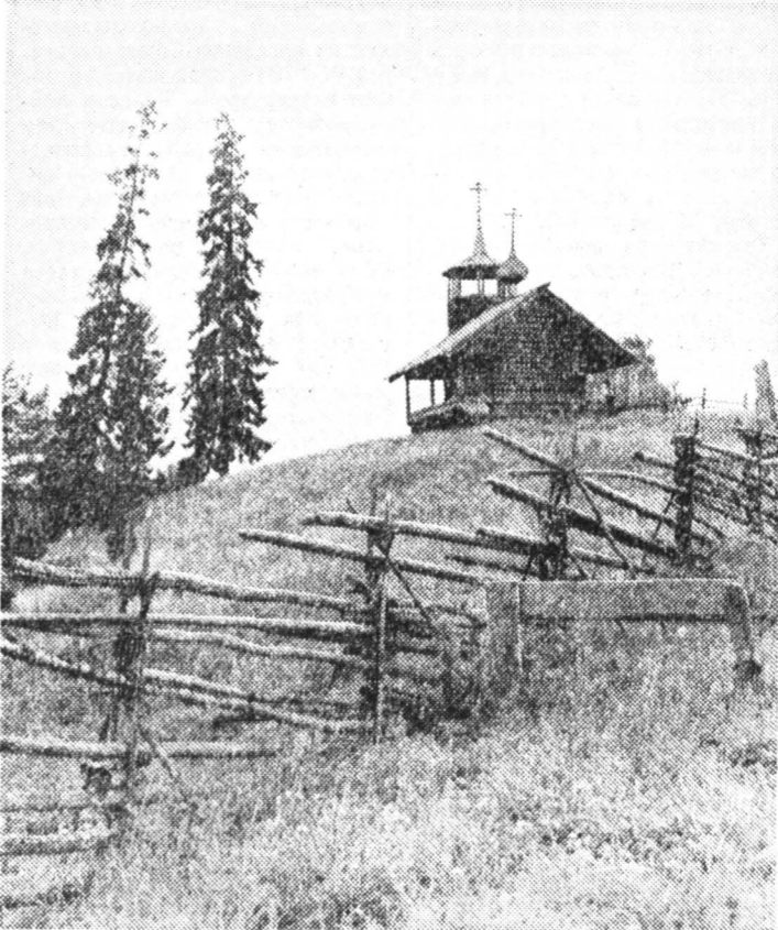
Часовня XVIII века Иоанна Богослова в деревне Зихново Архангельской области.