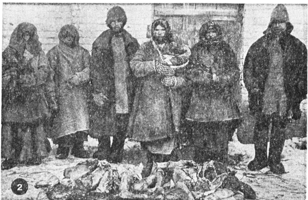
1. Умирающая мать с ребенком. 2. Людоеды голодающей губернии. Фотографии сделаны «московским корреспондентом тов. Либерманом, направленным в специальную командировку в голодающие губернии» (1921). Из фондов Музея революции. Публикуются впервые.

ГОЛОД, социальное явление, сопутствующее антагонистич. социальн.-экономич. формациям. <-> Г.А. причина Г.— присвоение эксплуататорскими классами значит. части нар. богатств, ограбление ими нар. масс. Г. выступает в совр. эпоху одним из проявлений всеобщего закона капиталистического накопления. <-> Научный анализ и история, опыт показывают, что Г. можно полностью преодолеть только в результате социалистич. переустройства общества. <-> Социализм устраняет причины Г., создает социальные и производст. условия для полного преодоления нехватки продовольствия. Это подтверждает опыт СССР. <-> Катастрофич. засуха 1921 благодаря эффективным мерам Сов. гос-ва не повлекла обычных тяжелых последствий. В построении социалистич. общества в СССР Г. и массовое недооедание полностью ликвидированы. БСЭ т. 7, М. 1972, стр. 32, стб. 83—84.