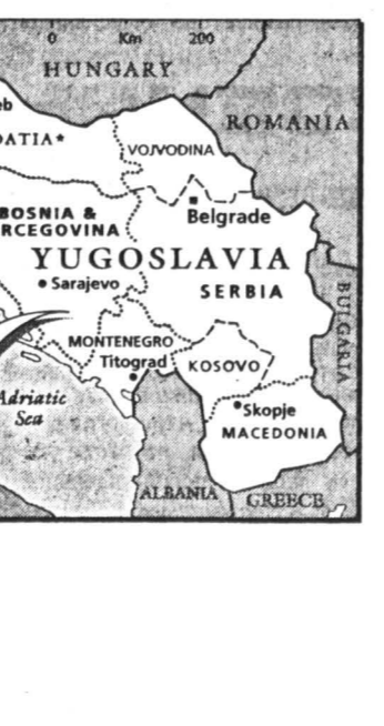
На карте Боснии и Герцеговины, которую мы перепечатаем из английского еженедельника «Экономист», показаны районы, где более 50 процентов населения составляют хорваты (темно-серый цвет), мусульмане (серый), сербы (светло-серый).

торий почти нет, и война, которая так трудно остановить, придет — и уже приводит — к великому переселению народов в самом центре Европы. Логика развития югославских событий была против ПДА. Даже Хорватское демократическое содружество (ХДС), оказавшееся вследствие сербхорватского конфликта естественным союзником мусульман, хотело бы для себя в новом государстве каких-то национальных гарантий, не говоря уже о Сербской демократической партии (СДП). И мусульмане были вынуждены согласиться с идеей «кантонирования». В конце кон-