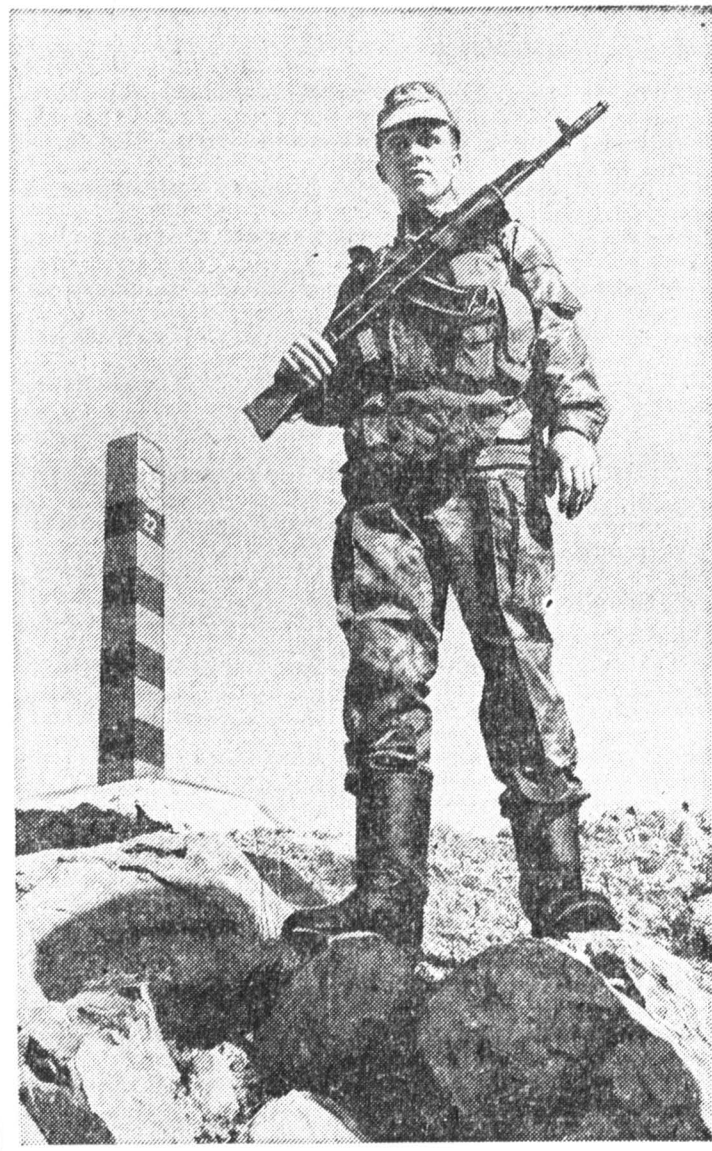
На этом участке границы еще сохранился пограничный столб.