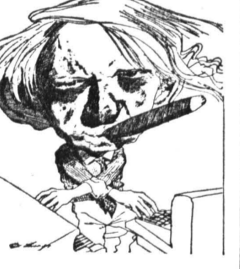
Рисунок Дэвида Ливинга (США).