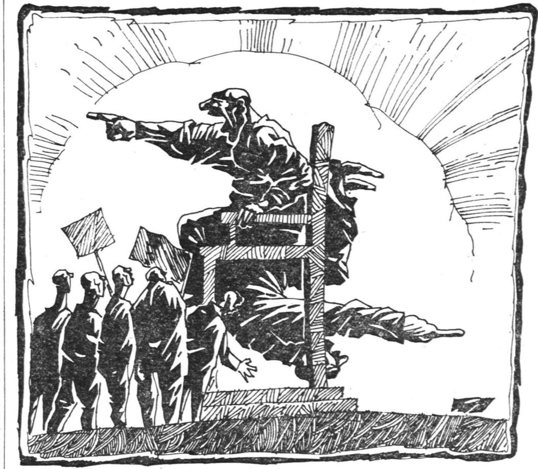
Рисунок Алексея Меринова.