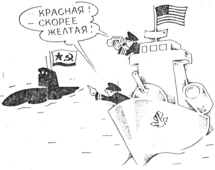
Рисунок Сергея Агаменко.

По ходу формирования российской армии министерства обороны должна начаться радикальная военная реформа. «Национализация» — перевод под рос-