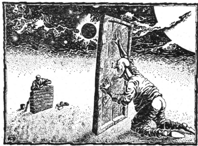
Рисунок Алексея Мерцкина.

сывающих в несколько рядов Белый дом. Люди стояли плотно друг к другу, взявшись под руки, и это была, несомненно, новая форма революционной борьбы, введенная русскими. Восточные немцы дисциплинированно скандировали лозунги, несли к тому особенно веселились, прибавляя без конца пели народные и патриотические песни — русские же молча стояли. Исключительно удачно было выбрано и место для проведения акции «Защита». Самой потрясающей находкой было то, что район Москвы, где она проводилась, прямо связан с темой баррикад, которые впервые были воздвигнуты здесь во время революции 1905 года. Соответственно участии выходили, направляясь к месту действия, называется «Баррикадная». Наиболее эффектная часть инсталляции была сооружена возле