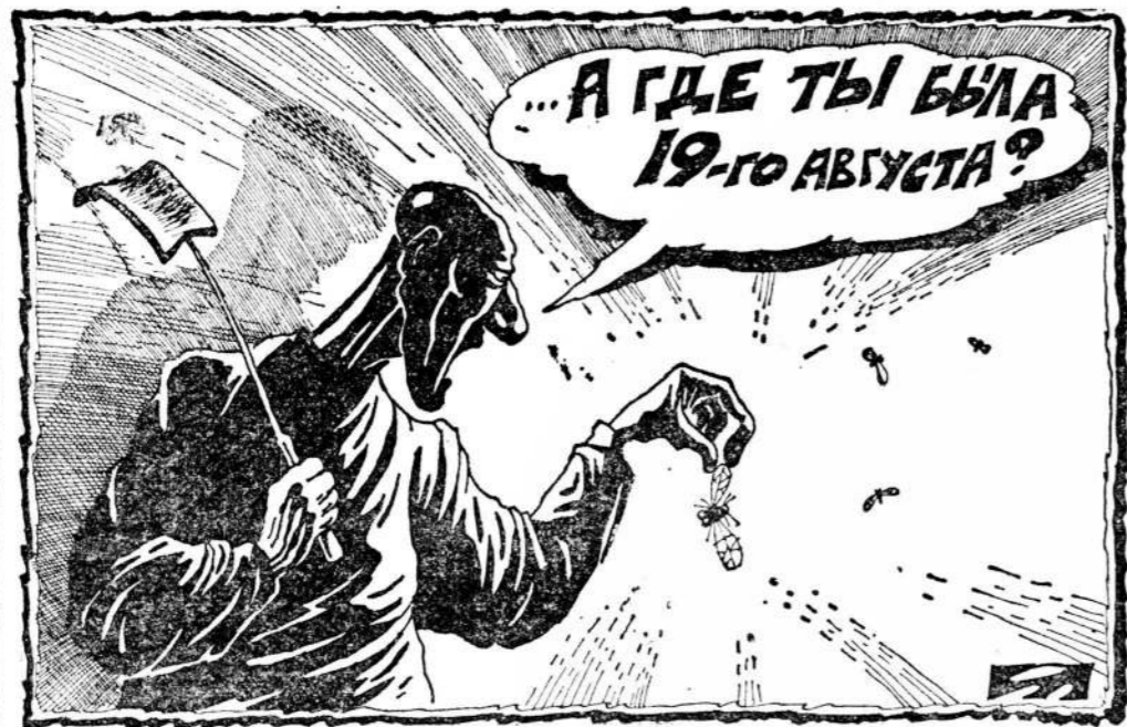
Рисунок Алексея Меркулова.

Государственный переворот 2000 лет назад