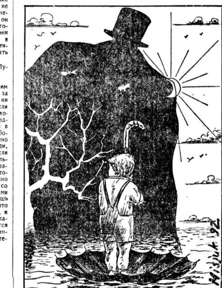
Рисунок Вацлава Мисюка.

Выбирая книжку для детского чтения, хорошо бы помнить, что ребенок, будучи от природы фашизидным типом (познавая «внешнее», он, как правило, наивно-индивидуалистичен, а развязываясь во «внутреннем», погружен в коллективное бессознательное), нуждается в преодолении своего возрастного (фашизидного) психотипа через цивилизованное воспитание.