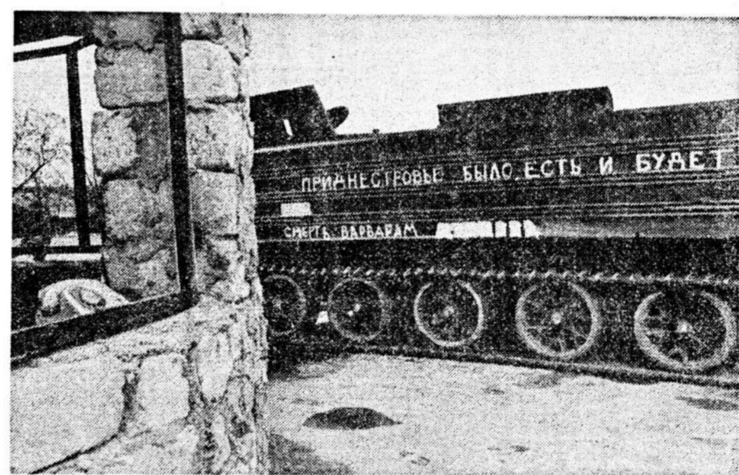
Самое известное место Дубоссар — пост ГАИ на развилке у моста. До того как был взорван мост, этот ключевой пункт не раз с боями переходил из рук в руки.

Однако, судя по всему, таких будет немного. В Тирасполе указ президента Молдовы встретили как своеобразное объявление войны со стороны Кишинева. Президент Приднестровской республики Игорь Смирнов в ответ издал указ о введении командантского часа на всей территории Приднестровья, так как здесь чрезвычайное положение было введено еще раньше. За минувшие два дня после введения чрезвычайного положения ситуация в зоне конфликта не претерпела существенных изменений. Во всяком случае, в лучшую сторону. С обеих сторон наблюдается концентрация сил и технических средств. Полиция Молдовы укрепила занимаемые плацдармы в районе села Кочичера, а гвардейцы подтягивают дополнительные силы из Тирасполя. Не нужно быть большим специалистом, чтобы понять: если политическое решение найдено не будет, то в Приднестровье в ближайшие дни могут развернуться крупномасштабные боевые действия. Об этом шла речь и в обращении президента М. Снегура к народу Молдовы, в котором он заявил, что «терпение на пределе, а лидеры Приднестровья отвергли все предложения руководства Молдовы». В воскресенье президент в сопровождении председателя парламента А. Мошану посетил зону конфликта с целью поднятия боевого духа защитников целостности Молдовы. Поблагодарив бойцов за поддержку, президент подчеркнул, что руководство ответственно за этот конфликт и сделает все, чтобы восстановить законность в Левобережье как можно меньшим количеством жертв. Мирча Сне-