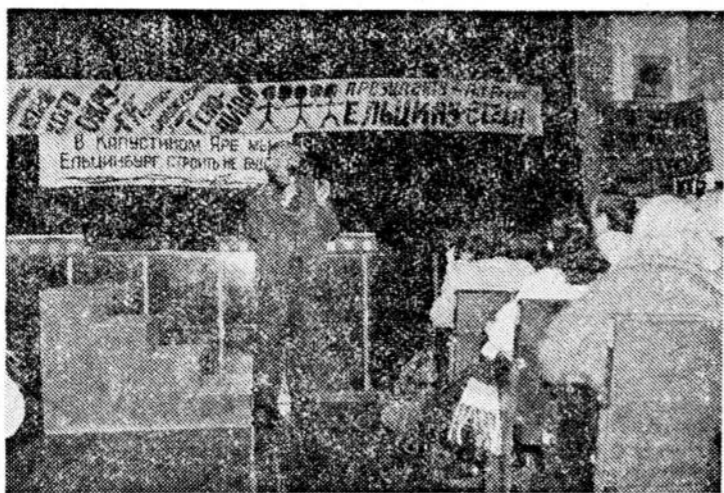
Новосибирск. Немецкий культурный центр. Они приходят сюда и говорят об отъезде.