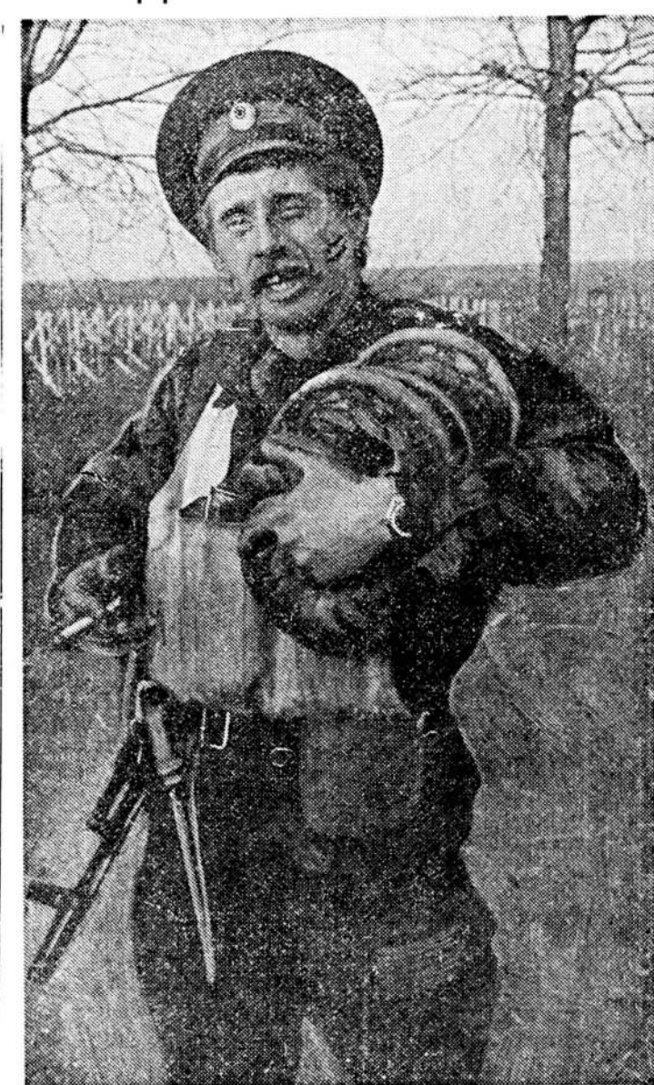
На левом берегу казаков любят. И кормят.