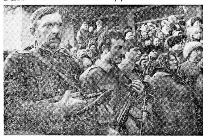
Казак на похоронах приднестровского гвардейца.

Так считает походный атаман Войска Донского