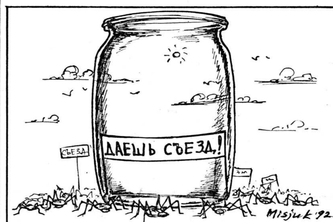
Рисунки Вадима Мисюка