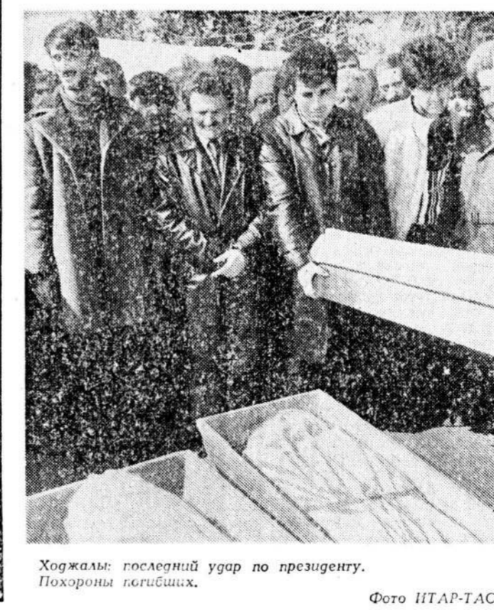
Ходжали: последний удар по президенту. Похороны погибших.

этого столь скоро, если бы не стремительное падение популярности экс-президента в среде правящего посткоммунистического истеблишмента. В центре минувшего года Муталибов, обидевшись на то, что назначенный парламентской оппозицией президентом Азербайджана в этой автономии, преврал почти все контакты с лидерами Национального фронта Азербайджана, что привело к политической и экономической изоляции автономии Азербайджана. До вступления в силу конституции Азербайджана Муталибов, будучи президентом, не считал своим долгом поддерживать отношения с оппозицией. Но Старая площадь плакала тогда Муталибова, а Гасанову пришлось довольствоваться ролью премьер-министра. Тем не менее, отношения между президентом и премьером, свидетельствует хотя бы то, что в августе 1990 года по приказу Муталибова был закрыт учрежденный Гасановым «независимый» «Республиканский» телеканал. Муталибов опубликовал интервью Гейдара Алиева.