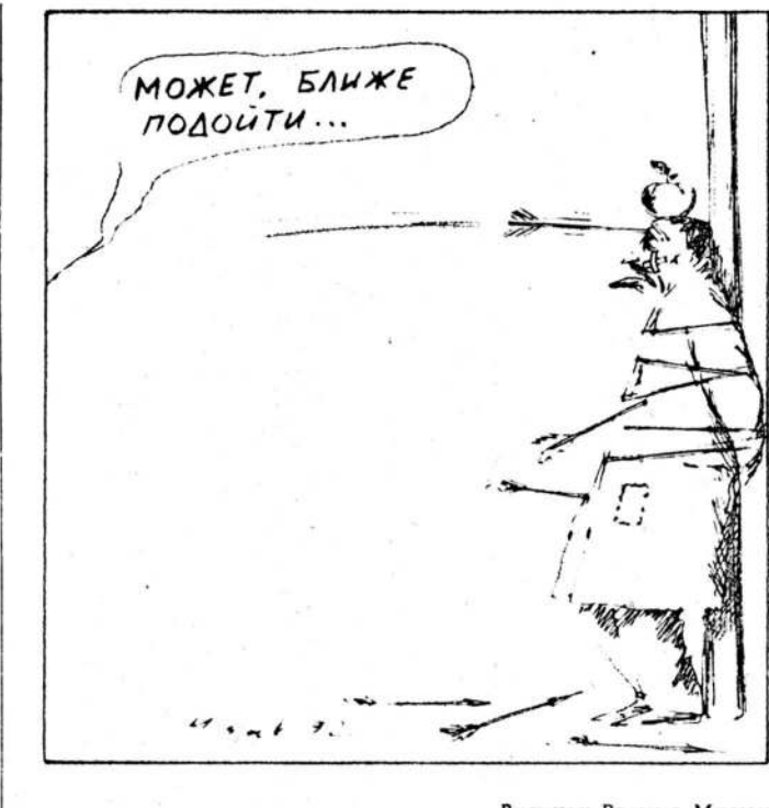
Рисунок Рагуля Мусюка.

Во-вторых, видимо, необходимо сменить парадигму экономической политики. Уже внесены серьезные коррективы в экспортные тарифы, в частности, по отношению к ставкам налога на добавленную стоимость. По экспертным оценкам, доходы бюджета только за февраль уменьшились на 30 млрд. руб. Учитывая продолжающееся сокращение экспортных доходов, необходимо рассмотреть возможность введения эмиссионного налога с целью добровольной ассоциации центральных банков. Если же удастся подписать многостороннее соглашение, целесообразно перенести акцент на заимствование иностранных валютных ресурсов. Это позволит не только обеспечить денежную стабильность, но и ответственность банкам за проведение экономической политики.