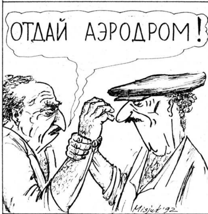
Рисунок Вагима Мисюка.

ДОСТИГНУТОЕ соглашение о прекращении огня на трое суток с 9 утра 27 февраля, о котором было заявлено вчера вечером Министерством иностранных дел Армении, связывают с предстоящим визитом министра иностранных дел Ирана Али Акбара Велаяти, который пока находится в Баку и не может прибыть в зону боевых действий из-за непрекращающегося огня. Однако уже с утра 27 февраля перемирие было нарушено азербайджанцами, реакция которых на захват армянскими силами самообороны Ходжалы выразилась в широкомасштабном наступлении на Аскеранский район НКР по всему фронту. В бой брошено большое количество бронетехники и боевые вертолеты Ми-8 и Ми-24. По всей протяженности границы идут упорные бои против наступающей азербайджанской армии. Это обстоятельство делает неясными перспективы предстоящего визита в регион Велаяти, поскольку азербайджанская сторона не гарантирует ему безопасность из-за продолжающихся