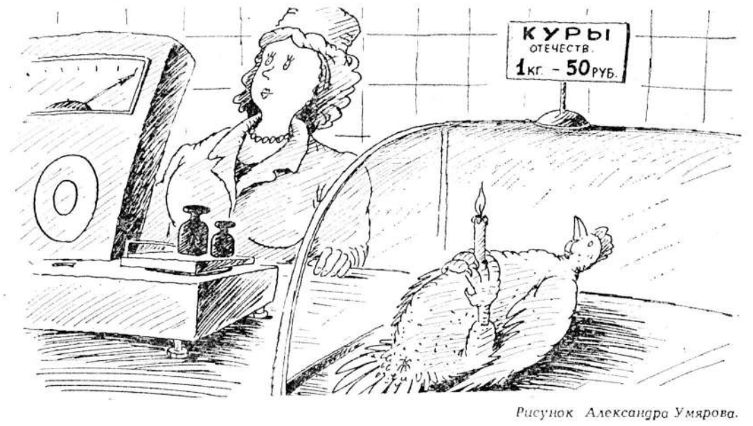
Рисунок Александра Умарова.

Подобное звучало практически в каждом выступлении. Резкой критике подверглись заявления вице-президента Рущиного на съезде патриотических сил России. Военнослужащий из Казахстана заявил, что 39 тыс. офицеров — выходящих из Беларуси и переходящих службу за пределами своей родины — готовы, в