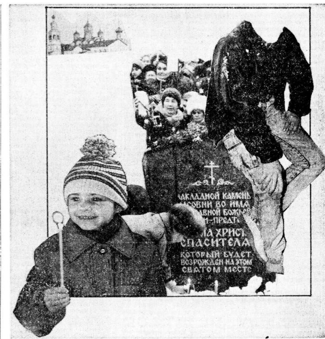
Коллаж Вагины Мисюжко.

Например, современная семья и отношения полов. Западная культура и церковь сумели добиться того, что обиходно называется неоконсерватизмом, а по существу представляет собой качественно новое состоя-