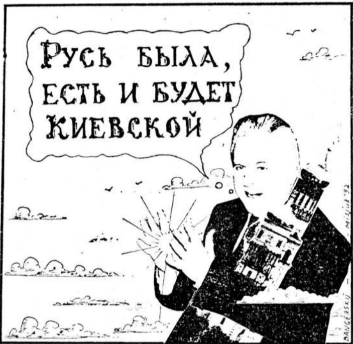
Рисунок Ваима Мисюка.

Обсуждался также соглашение о статусе стратегических сил Содружества. В этом соглашении есть два спорных вопроса. Во-первых, Украина выступает за то, чтобы стратегические силы были самостоятельными с отдельным командованием. А Россия предпочитает вариант, когда стратегические силы являются частью объединенных вооруженных сил СНГ