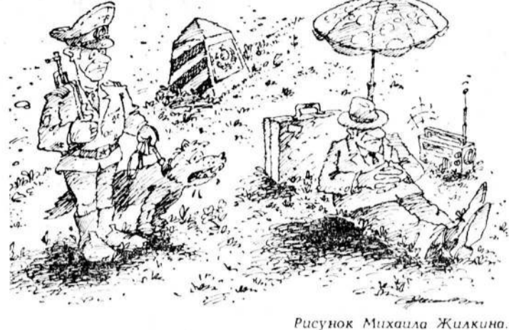
Рисунок Михаила Желкина.