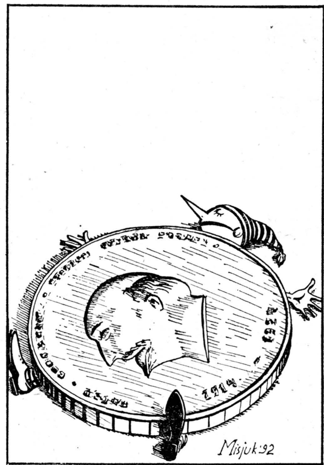
Рисунок Вадима Мисюка.

Иди, куда влечет... Пушкин Ступай себе мимо... Некрасов