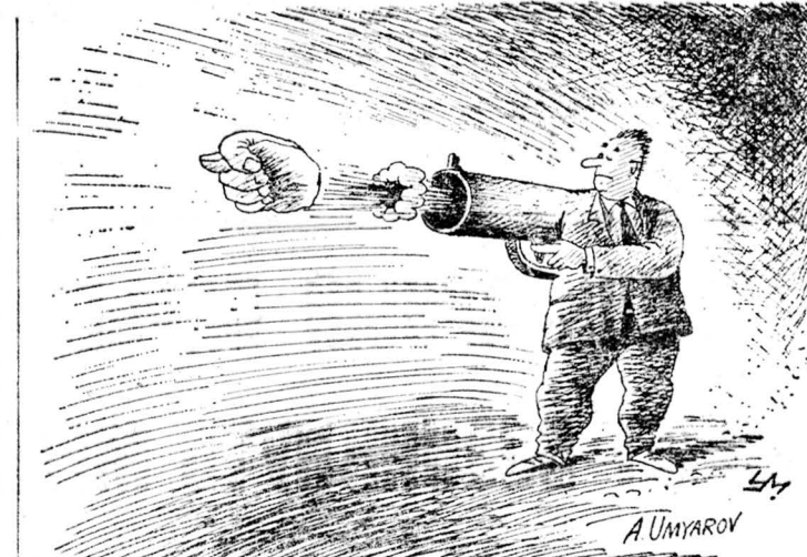
Рисунок Александра Умарова.

С января обстановка вновь стала накаляться. ВС РФ наконец стало стремиться перечислить принцип разделения властей и поднять под себя все исполнительные структуры. Открытое заседание 7 февраля, на котором планировалось де-юре осуществлять «парламентский переворот», Руслан Хасбулатов говорил о том, что парламент обижает и вальсически желает ослабить. Эта жалоба выглядела довольно странно, если учесть,