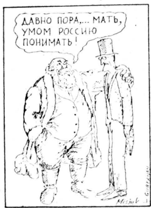
Рисунок Вагима Мисюка.

— Что вы в таком случае собираетесь предпринять? — Поживем — увидим. Надеюсь, в скором времени российский правительством поймет абсурд-