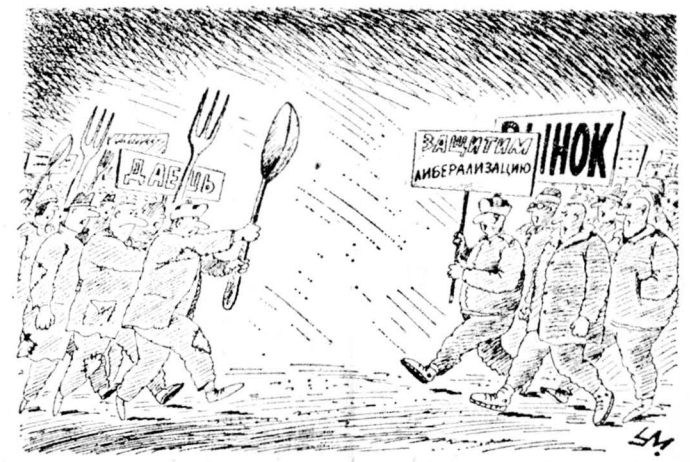
Рисунок Александра Умырова.

Право, даже нелепо, по крайней мере после Макса Вебера и всех дивлившихся десятилетиями вокруг его работ дискуссий, спорить об этом с доктором полити-