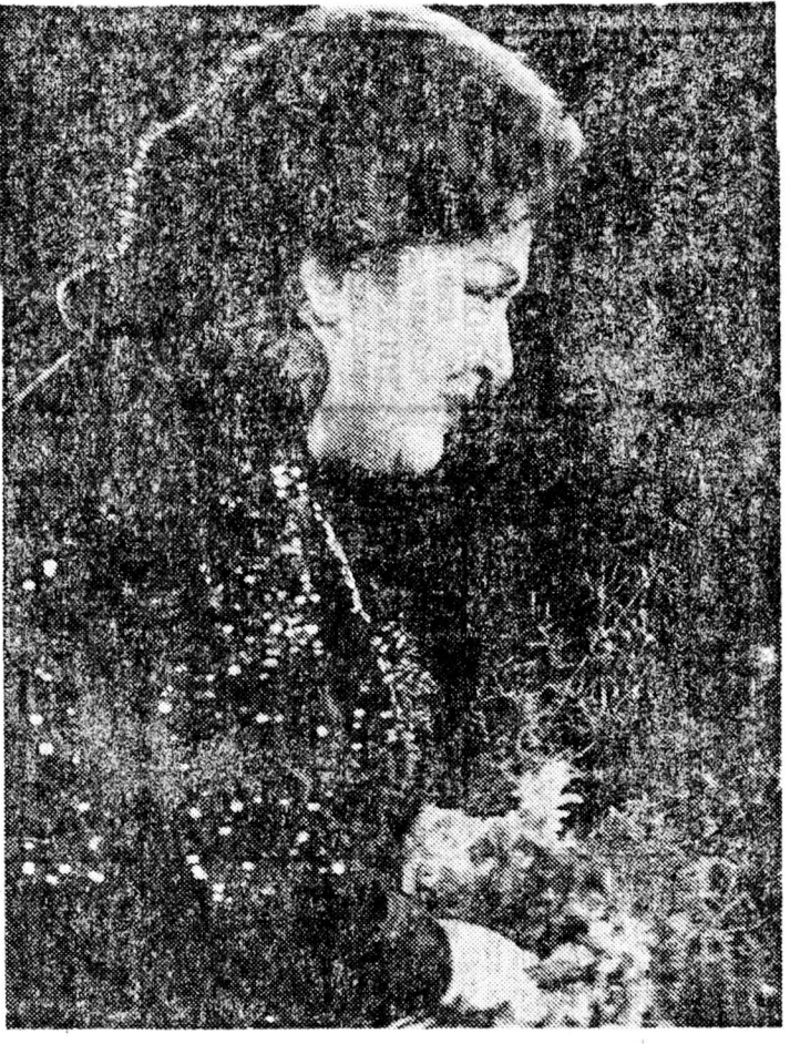
(Большой театр)

В империи вокала можно без труда назвать владычицу, первых дам королевства. Среди бесспорных оперных примдонн России Ирина Архипова занимает особое место: она не только выдающаяся певица, блистающая на одной сцене Большого театра, выступавшая в «Ла Скала» и «Ковент-Гарден», «Гранд Опера» и Римской опере, но и бессменная председатель жюри на Всесоюзных конкурсах имени М. И. Глинки и Международных конкурсах имени П. И. Чайковского, профессор Московской консерватории, президент Международного союза музыкальных деятелей, а теперь еще и председатель оргкомитета Международного конкурса имени С. В. Рахманинова. В коротком промежутке между гастролями поездами — в Вильнюс и Казань, где певица выступала с концертами, и в Екатеринбург, где в оперном театре проводился фестиваль «Ирина Архипова представляет», — легендарная артистка согласилась ответить на вопросы «НГ».