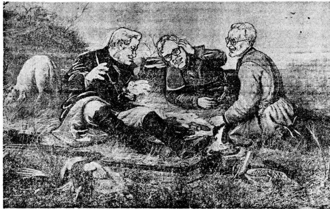
Коллаж Вагима Мисюка.

○ Россия не будет проводить в 1992 году крупные учения с