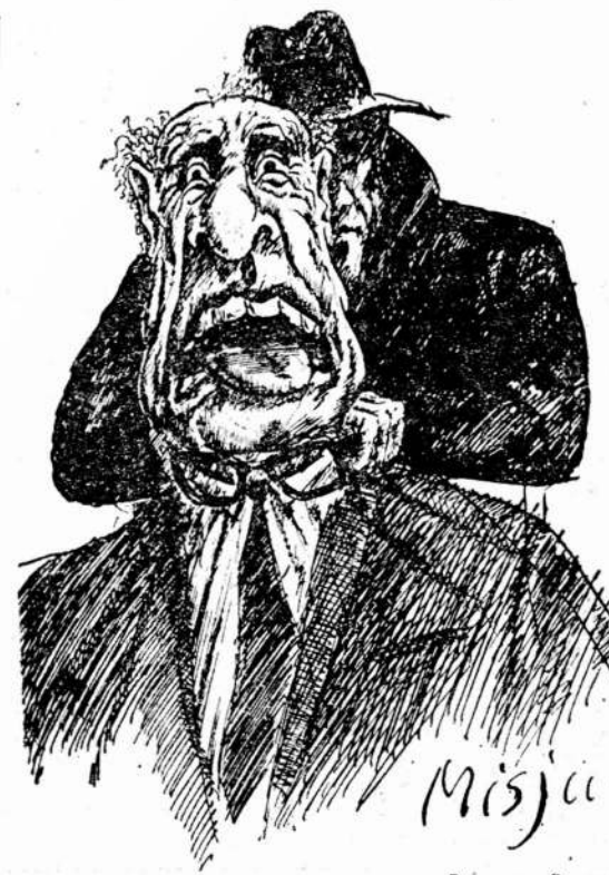
Рисунки Вацлава Маслова.