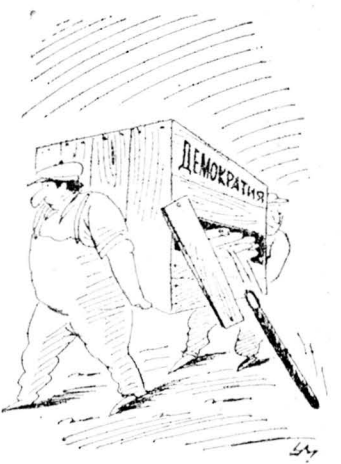
Рисунок Александра Умарова.

РАБОТНИКИ ВПК, долгое время жившие в строгом соответствии с укладом системы, не слишком оригинально, но верно известую государственное в хозяйстве, не хотят больше подчиняться его до сих пор неизменным законам. Люди, десятилетиями работавшие на обладателя львиной доли бюджетного пирога, оказались сегодня в числе наименее защищенных и соответственно наиболее социально нестабильных групп населения. Замена союзного флага российским триколором, сопровождаемая декларациями демократических реформ, судя по всему, не разделила обстановку.