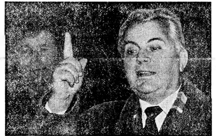
А. Кравчук.

Леонид Кравчук со свечой в конце тоннеля