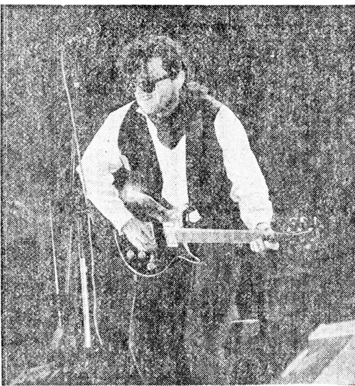
«Ультима Туле». (Эстония).