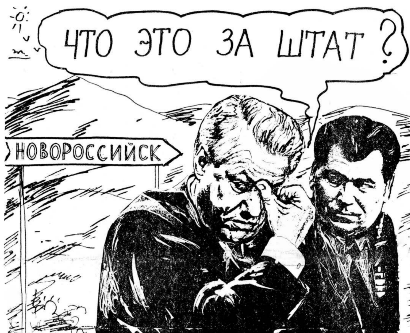
Рисунок Вадима Мисюки.

Основными задачами Украины в настоящее время он назвал экономическую реформу и социальную защиту населения.