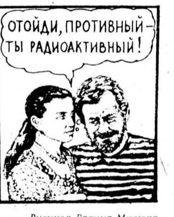
Рисунок Вадима Мисюка.