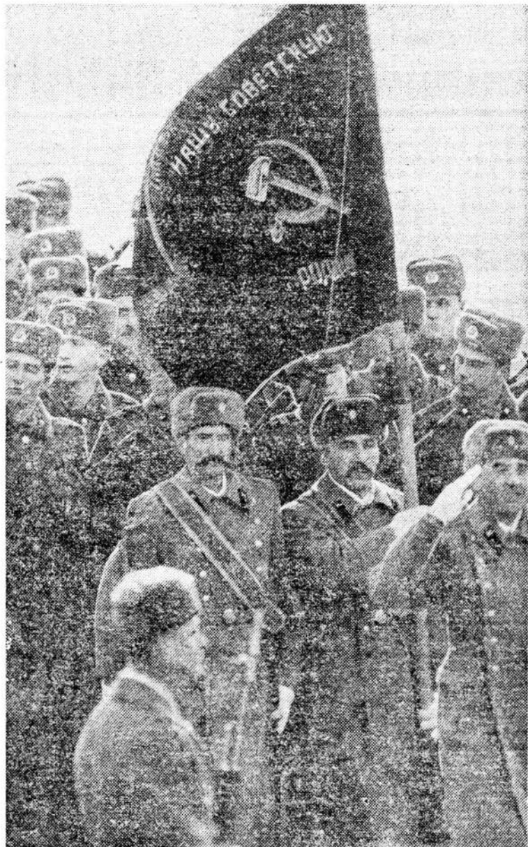
После присяги под старым флагом.