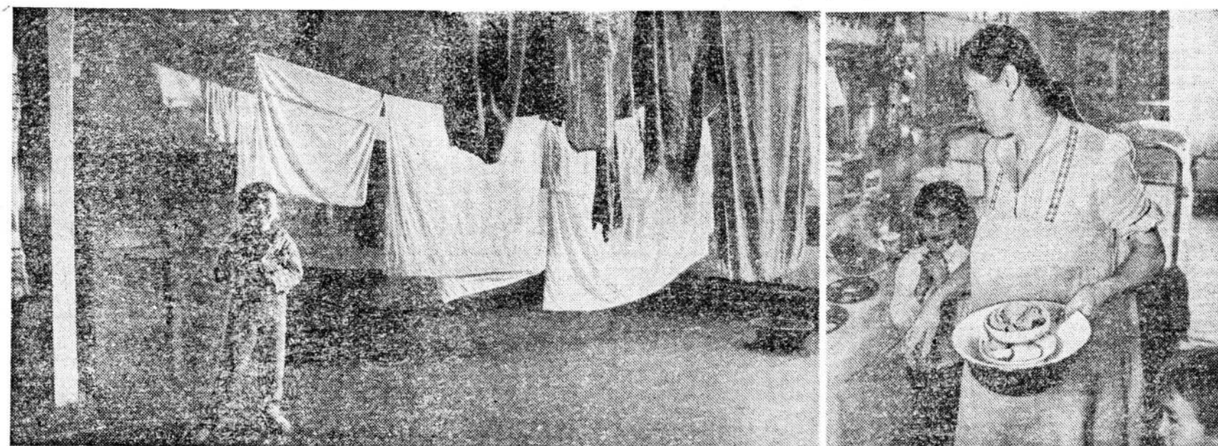
В офицерском общежитии.