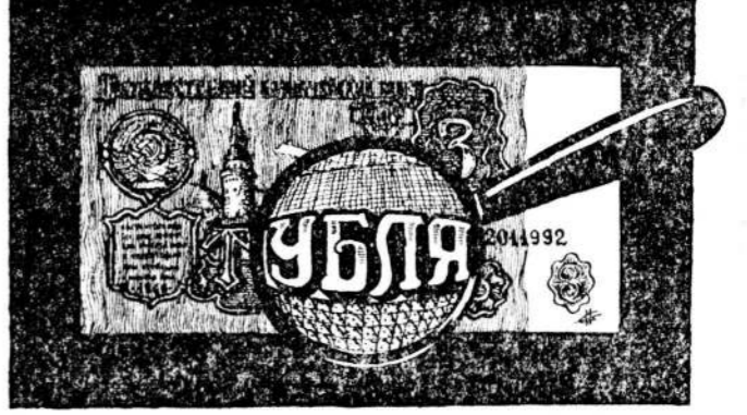
Рисунок Сергея Неволина.