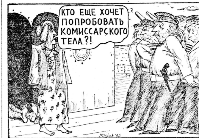
Рисунок Вадима Мисюка.

«Смысл нашей революции в том, что мы возвратили все вещи и явления к их естественной природной норме», — разъясняют политратору будущим служанкам инструкторши в центрах Рахили и Лии. Но таким образом человечество (в романе «Повесть о служанке») еще раз призвано убедиться в том, что жизнь, подчиненная исключительно природным регуляциям, — это бедная и печальная, не достойная человека жизнь. Оставшаяся жизнь не сохраняет, какую угодно, хоть североамериканских идеалов, которые смогли восстановить свою первоначальную численность только в сегодняшней сверхиндустриальной и сверхлиберальной Америке. Это знает уже не служанка из романа, а мы, его читатели. Роман приобретает сугубо ироническое звучание: в нем подвергнуты сомнению не только эксцессы феминизма, но и возможные меры против таковых, отрицаются как извеще-