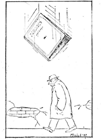
Рисунок Ваима Мисюка.