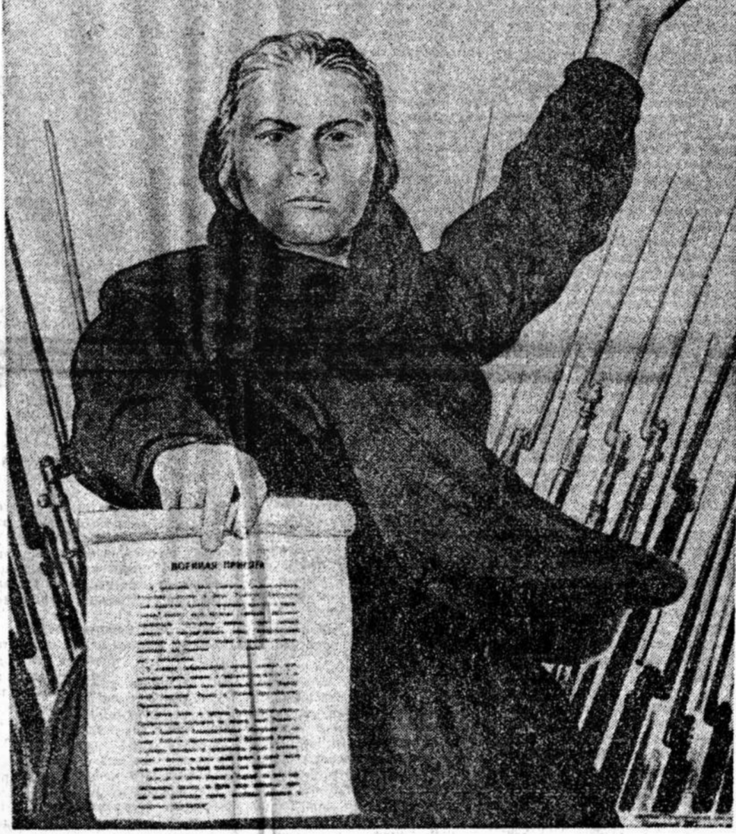
Родина-мать зовет! Плакат художника И. Тогура.