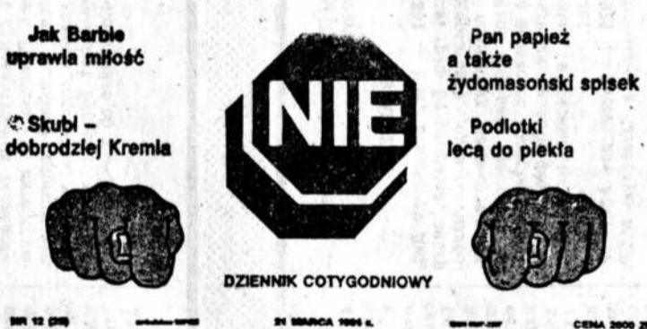
«Шалко» еженедельника «НЕТ».