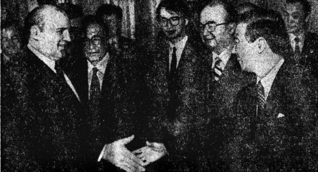
Токио, первый раунд...

именно закончит президент Горбачев свой визит в Японию. Однако уже сегодня можно утверждать, что этот визит (при всей его исторической значимости как первого по счету) не станет настоящим прорывом в советско-японских отношениях. Перед Горбачевым стояла практически невыполнимая задача: убедить японское правительство гарантировать инвестиции в СССР частных предпринимателей, не давая при этом никаких конкретных обещаний по поводу островов. Сейчас функционировало около 40 совместных советско-японских предприятий, в которые японцы инвестировали сумму, соответствующую 0,1 процента общей суммы зарубежных японских инвестиций. Японские бизнесмены начинают вообще свертывать свои дела в Советском Союзе (о причинах уже много писали). В этой ситуации единственно возможные инвестиции в экономику СССР — гарантированные японским правительством, которые не спешат давать гарантии до урегулирования территориальной проблемы. Есть реальные шансы на то, что нынешний раунд советско-японских переговоров на высшем уровне закончится тушением, если советский президент не вынет «кнопки из штыря». Вчера, выступая в японском парламенте, он уже осторожно намекал на возможность положительного решения территориального вопроса в недалеком будущем. В кон-