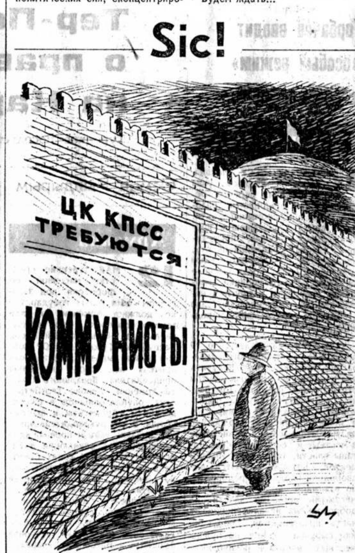
Рисунок Александра Умарова.