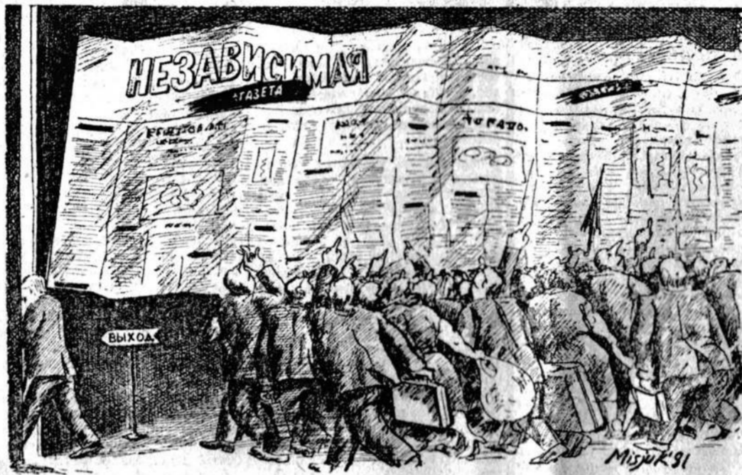
Рисунок Владимира Мисюка.

Регулярно выходят дайджест-приложение «НГ» «Собрание Независимой газеты». С нового года из ежемесячного издания оно станет двухнедельным, а за-