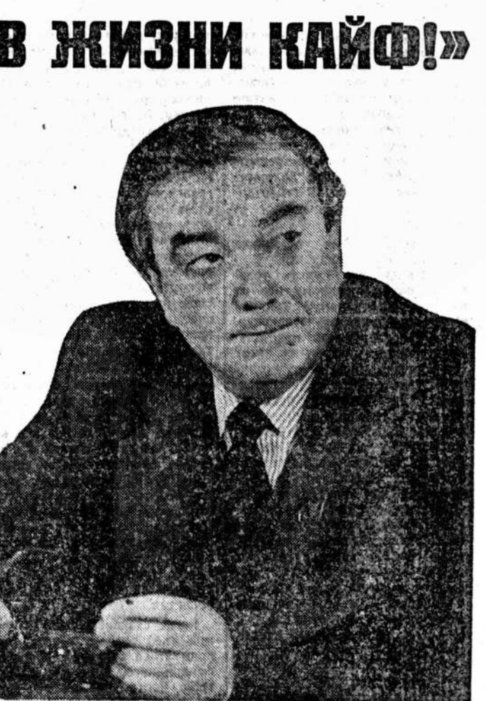
Евгений Примаков.

— Да и Грузия... как она будет жить? Что она станет продавать? Чай? Мандарины? Куда?