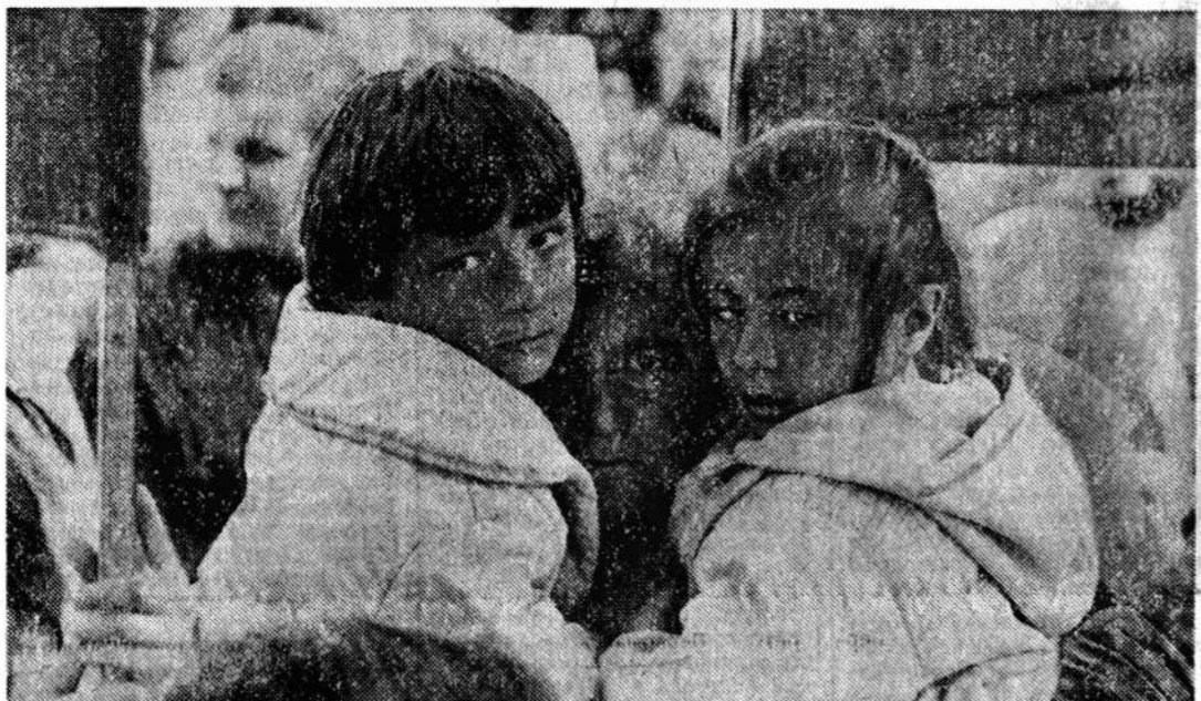
Беженцы в юга

и в Северной Осетии, имеет значительные шансы укрепить и здесь свое влияние — среди тех, кто раздражен позицией российского руководства, индифферентно наблюдающего за обострением ситуации на Северном Кавказе. Теперь даже для христианской Осетии становится заманчивой идея Дудаева о кавказском содружестве: президент Чечни обещает в его рамках решение трансрегиональных проблем и вступление в мировое сообщество полноправным членом.