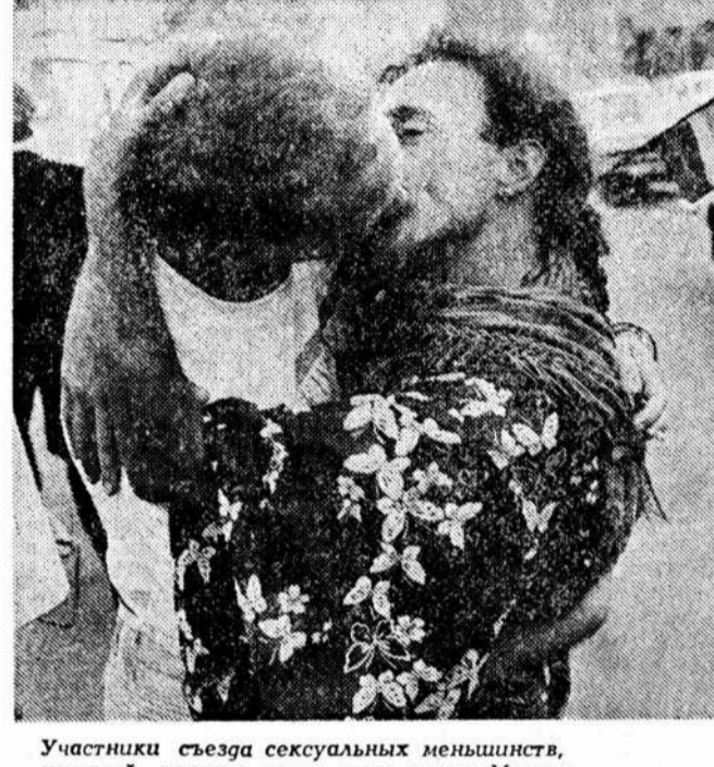
Участники съезда сексуальных меньшинств, который прошел летом этого года в Москве.

Отсюда очевидны и пути к прекращению эпидемии в этих странах — максимальное возможное сокращение гомосексуальности и дробление гомосексуалистов на изолированные группы.